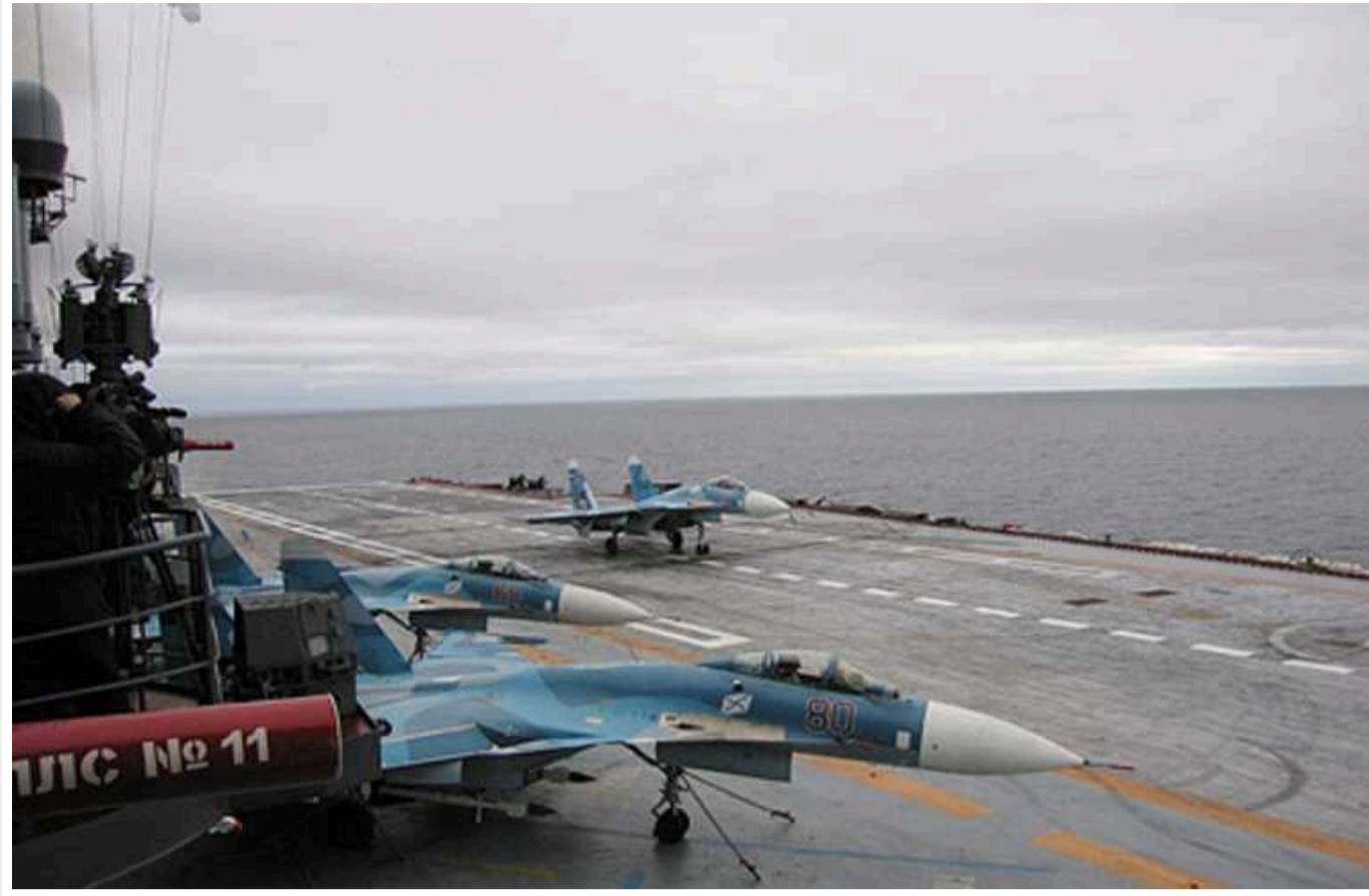
РФ перекидає флот і авіацію для військових маневрів поблизу кордонів США найближчими тижнями, - ЗМІ

Про це повідомляють провідні ЗМІ Заходу Reuters, Associated Press, CBS та ін, посиляючись на американських чиновників.