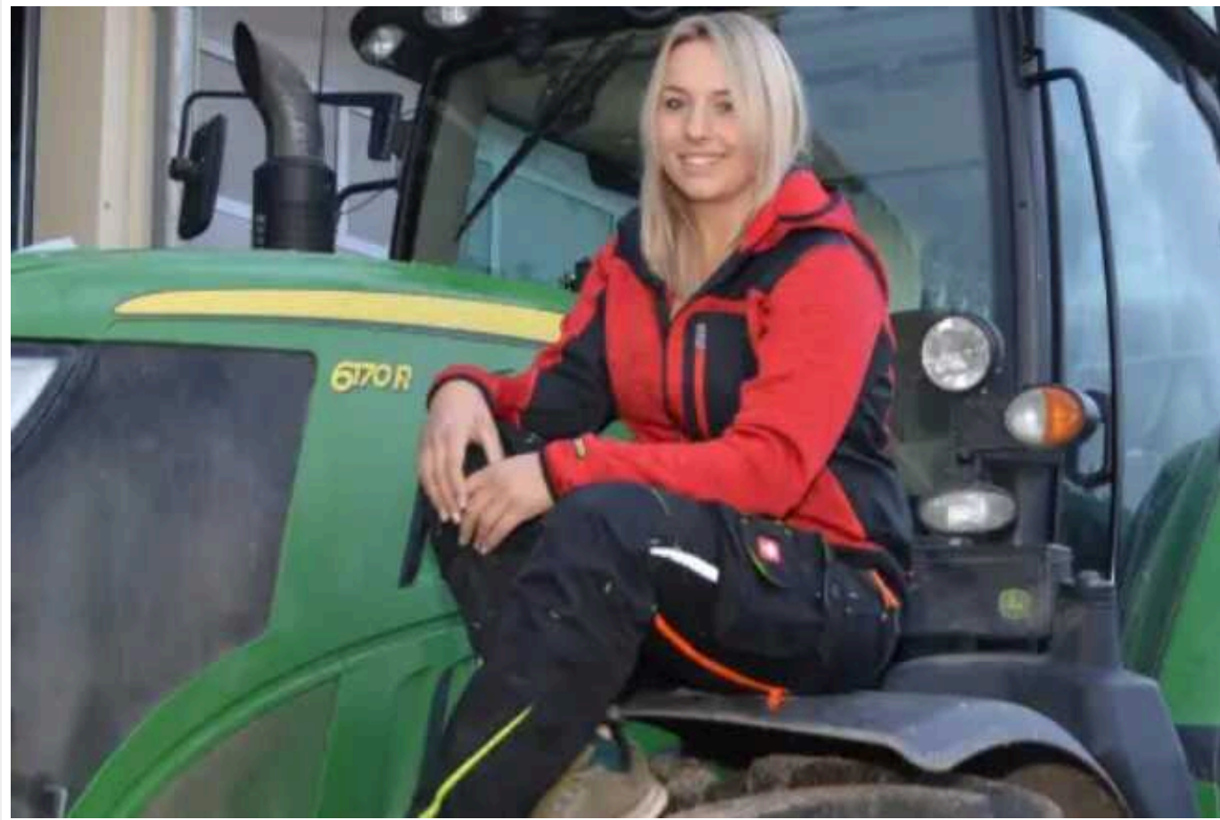
У Мінекономіки пропонують перенавчити жінок на «чоловічі» професії

Основними викликами для української економіки є дефіцит електроенергії і нестача кваліфікованих працівників.