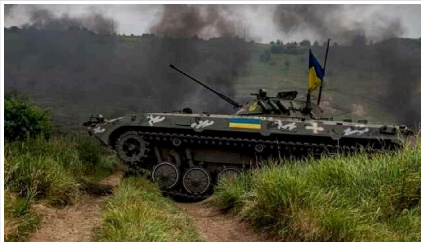
Генштаб: На Покровському напрямку окупанти здійснили більше 25 атак

Протягом доби, 6 червня, на Покровському напрямку кількість атакувальних дій з боку ворога зросла до 26.