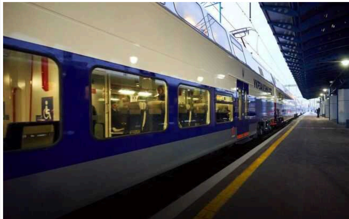
З Києва до Львова курсуватиме новий двоповерховий швидкісний поїзд

В Україні запускають новий швидкісний потяг Київ – Львів. Він курсуватиме кілька разів на тиждень.