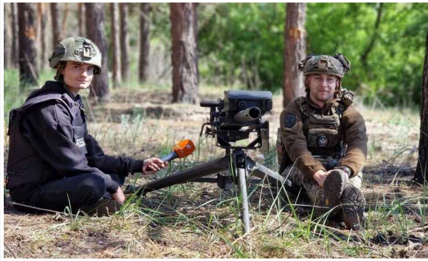
Зеленський привітав українських журналістів з професійним святом

У четвер, 6 червня, президент Володимир Зеленський привітав українських журналістів із професійним святом. Глава держави подякував кожному й кожній, хто висвітлює нашу боротьбу, хто на власні очі бачить жахи війни, допомагає Україні зберегти увагу світу, розповідає світові про наших людей.