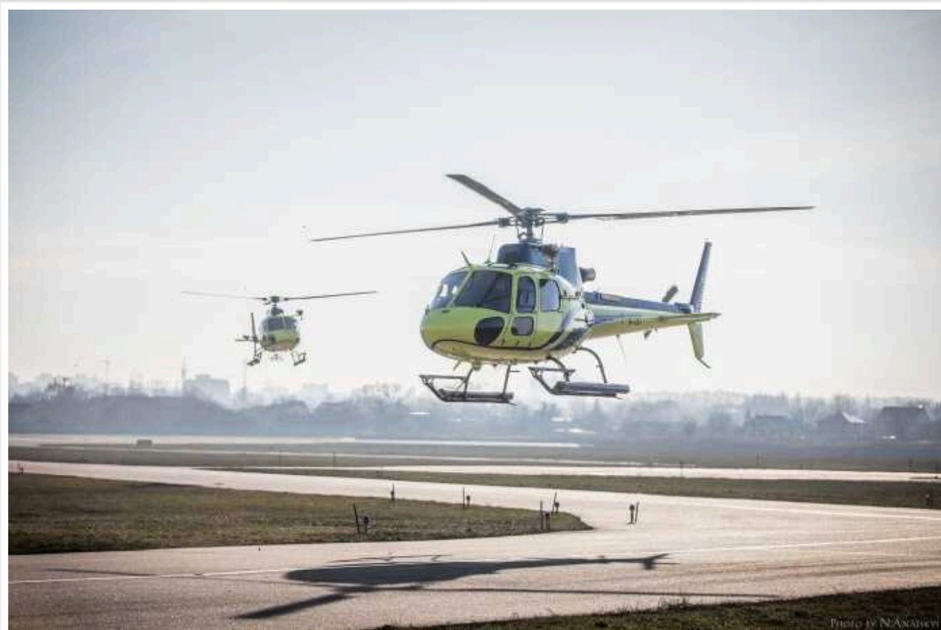
Німеччина за 1,9 мільярда євро придбає 44 поліцейські вертольоти Airbus

Німеччина замовила у компанії Airbus Helicopters 44 транспортних вертольоти на суму 1,9 млрд євро для своєї федеральної поліції.