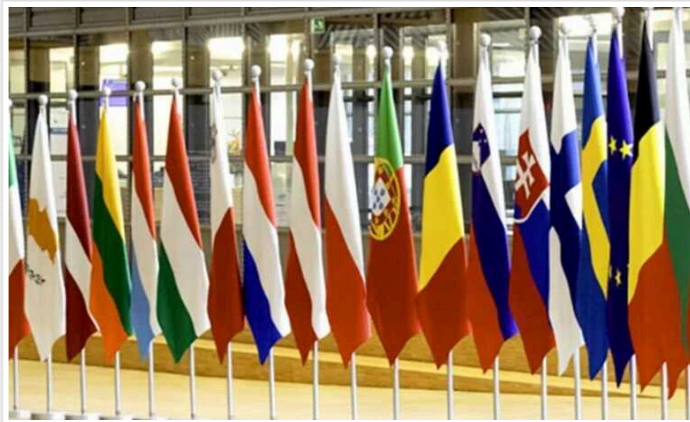
В ОП розповіли, які теми будуть обговорюватися на Саміті миру в Швейцарії

На Глобальному саміті миру у Швейцарії порушуватимуться питання, зокрема, повернення дітей в Україну та забезпечення продовольчої безпеки. Єдина країна, яку можна звинувачувати за подібні порушення, – держава-терорист Росія.