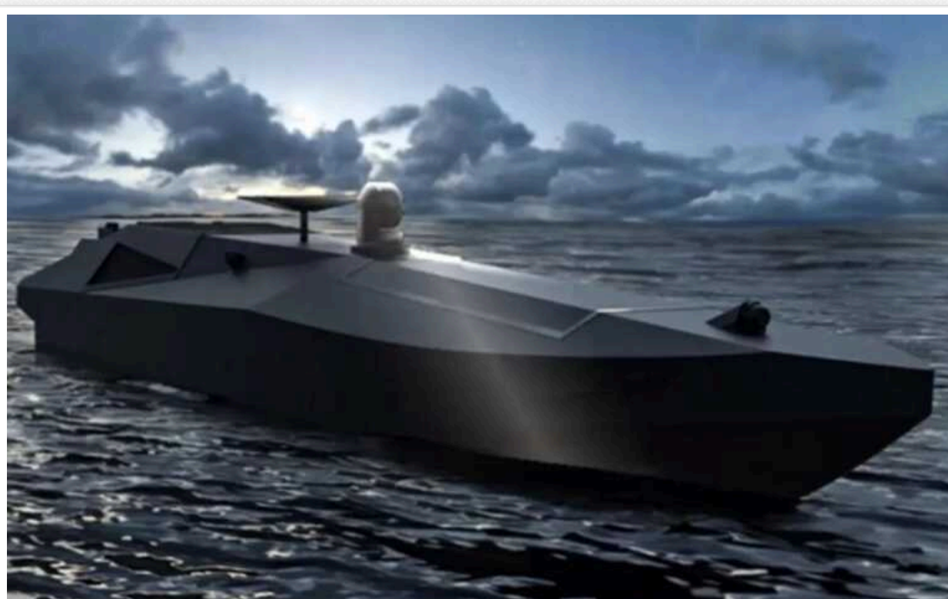
ЗСУ поставили ціль уразити порти Чорноморського узбережжя, які контролюють російські загарбники

Казанок у Криму кипить і булькає: удари по порту "Кавказ" 31 травня, по поромній переправі в Керчі в ніч на 30 травня й одночасні атаки на катерні стоянки в Західному Криму. Багатомісячна кампанія проти батарей С-300 й С-400, РЛС і частин РЕР на півострові дається ознаки?