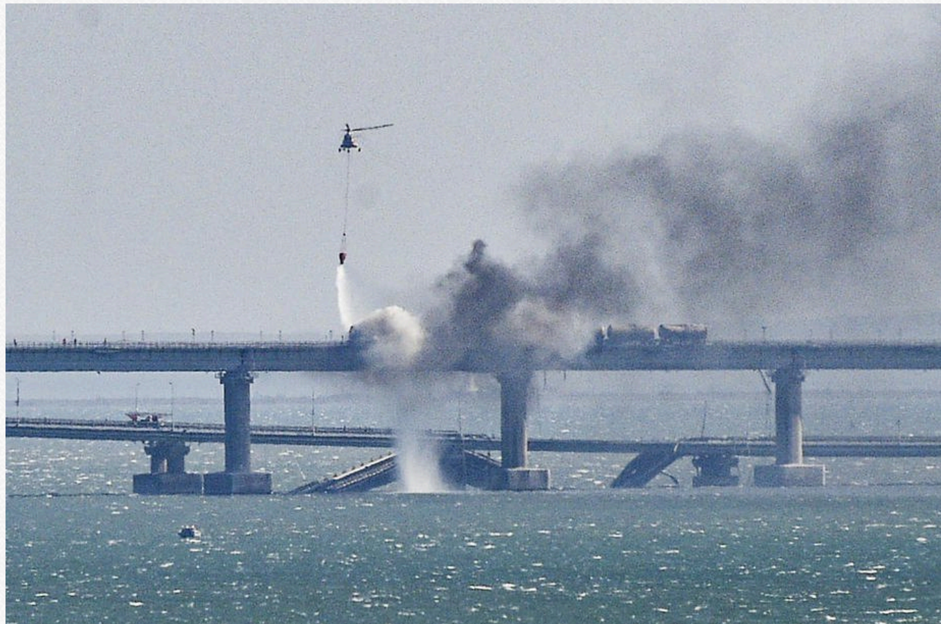
Ліквідація пожежі після ураження Керченського мосту.

Ураження автомобільної та залізничної логістики на півострові – після підриву прольотів Керченського мосту фури для МО РФ і цивільного сектору йдуть лише через поромну переправу.