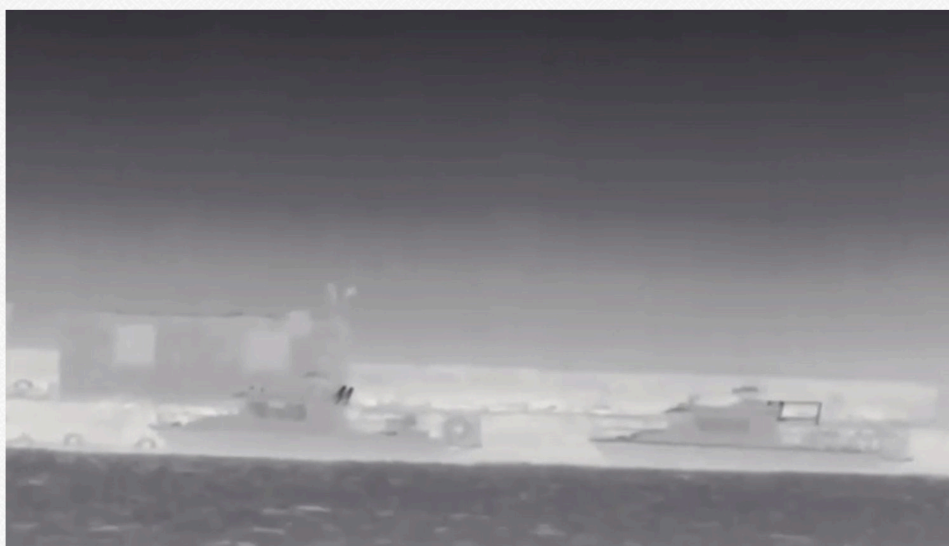
Російські катери у причалі морського дрона Magura V5, травень 2024 року.

Одна річ – кидатися ранніми ракетами до С-300 по Харкову, а інша – перехоплювати навіть дозвук, не кажучи вже про балістику. Ураження перевалки й цистерн з паливом на відстані 500 км, через лінію фронту й кілька районів об'єктової ППО – це великий успіх. Потрібно його масштабувати – порти Чорноморського узбережжя мають бути ключовою ціллю.