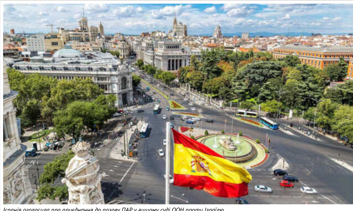
Іспанія оголосила про приєднання до позову ПАР у вищому суді ООН проти Ізраїлю

Іспанія стала першою європейською країною, яка звернулася до суду Організації Об'єднаних Націй із запитом на приєднання до позову Південної Африки проти Ізраїлю через військову операцію в Газі.