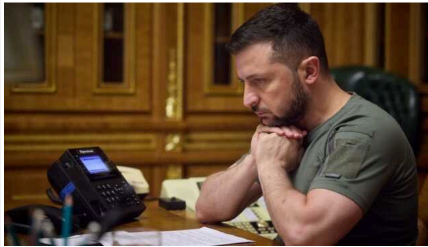
Зеленський провів телефонну розмову з прем'єром Індії: обговорили підготовку до Саміту миру

Президент України Володимир Зеленський провів телефонну розмову з прем'єр-міністром Індії Нарендрою Моді, під час якої привітав його з перемогою на виборах.