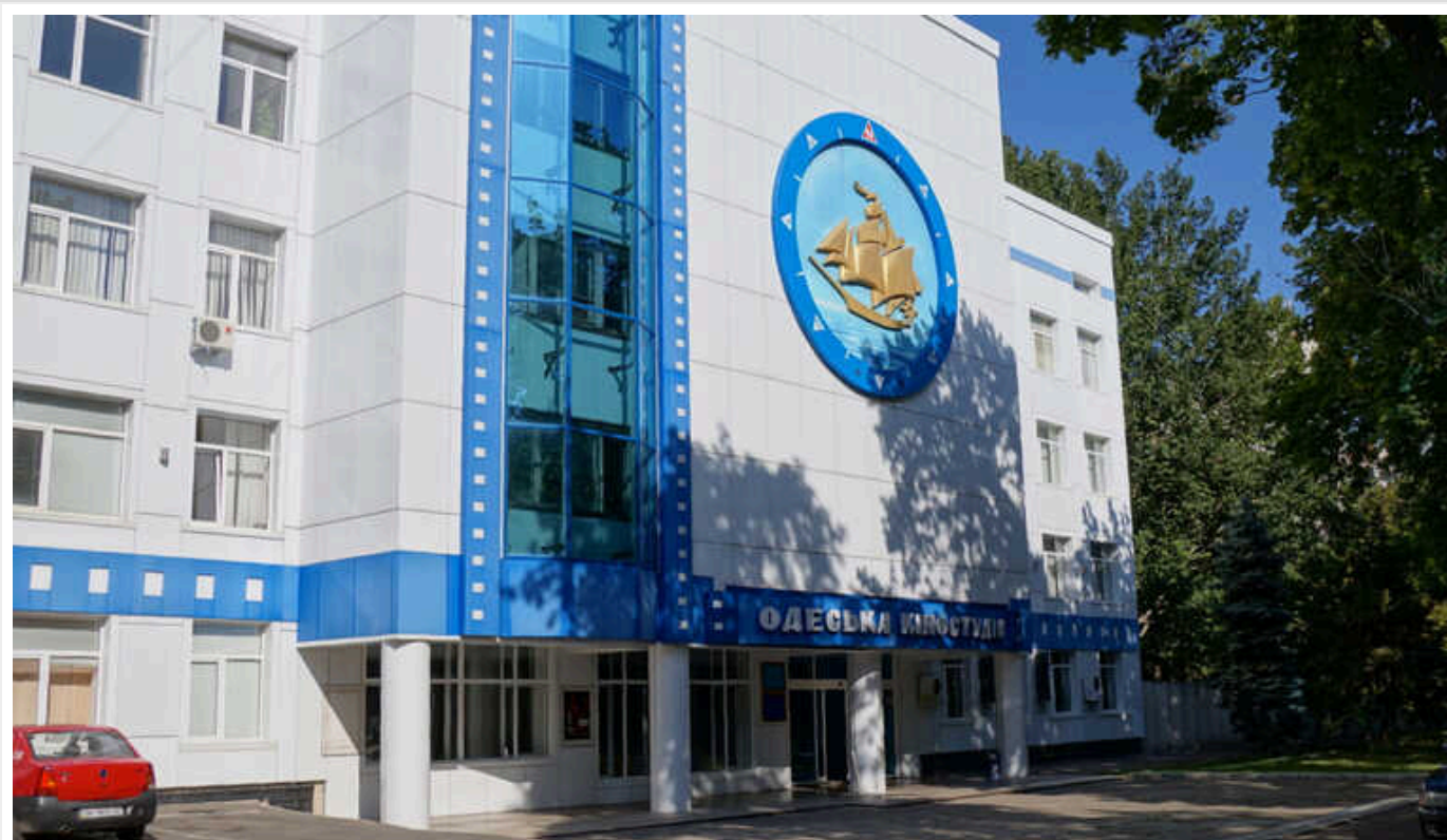
«Одеська кіностудія» надмірно витратила 400 мільйонів гривень

«Одеська кіностудія» через неефективні управлінські рішення керівництва та бездіяльність акціонерів стала збитковою і ризикує припинити своє існування.