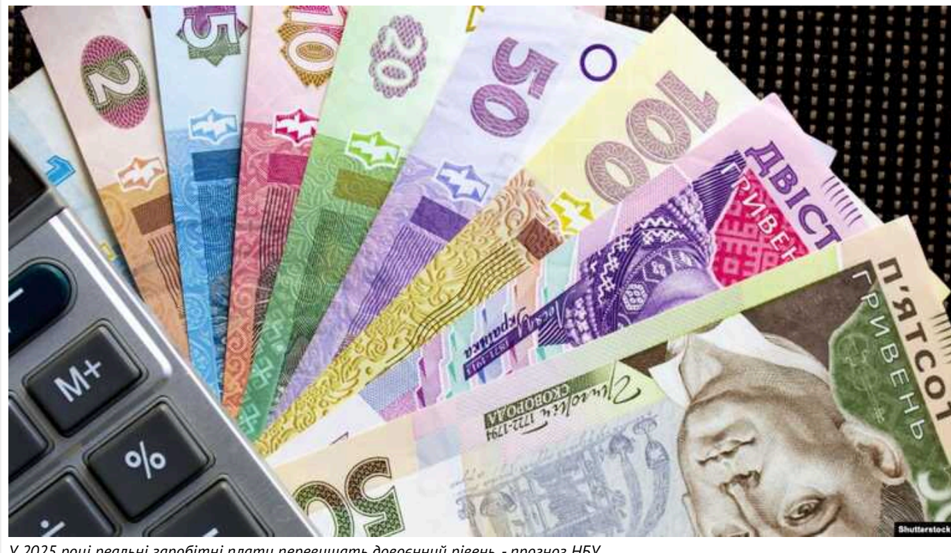
У 2025 році реальні заробітні плати перевищать довоєнний рівень, - прогноз НБУ

Це станеться через брак робочої сили, яка викликана міграцією та мобілізацією. Безробіття поступово знижуватиметься, а зарплати зростатимуть досить швидко.