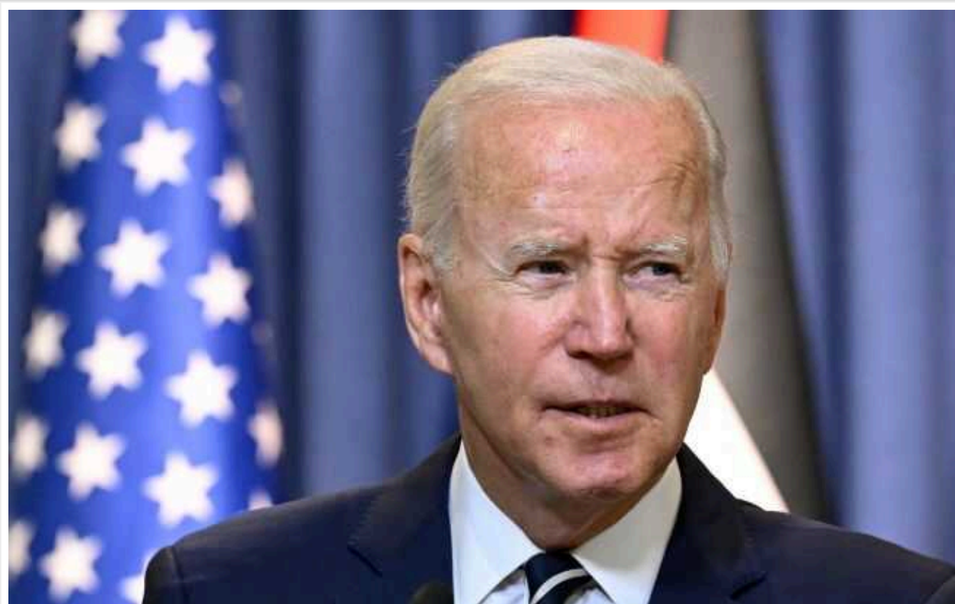
У США пояснили слова президента Байдена про необов'язковість членства України в НАТО

Напередодні американський президент Джо Байден заявив, що не готовий підтримати "НАТОвізацію" України. У місії США при НАТО пояснили його слова.