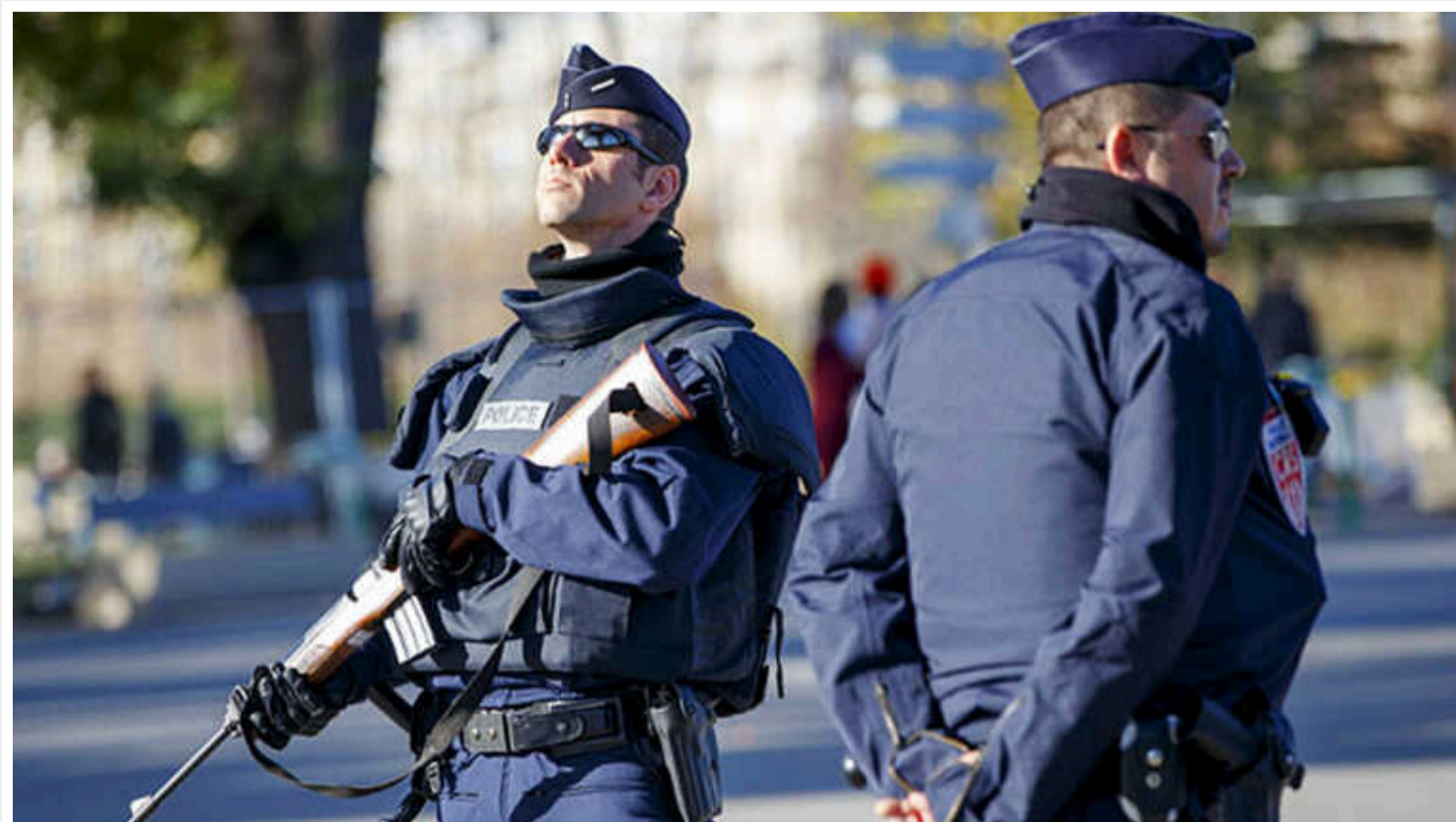
У Франції в готелі затримали українця із вибухівкою: міг бути російським агентом

26-річного громадянина України та Росії родом із Донбасу напередодні, 4 червня, затримали в муніципалітеті Руссї-ан-Франс на півночі Франції за підозрою в "участі в терористичній організації".