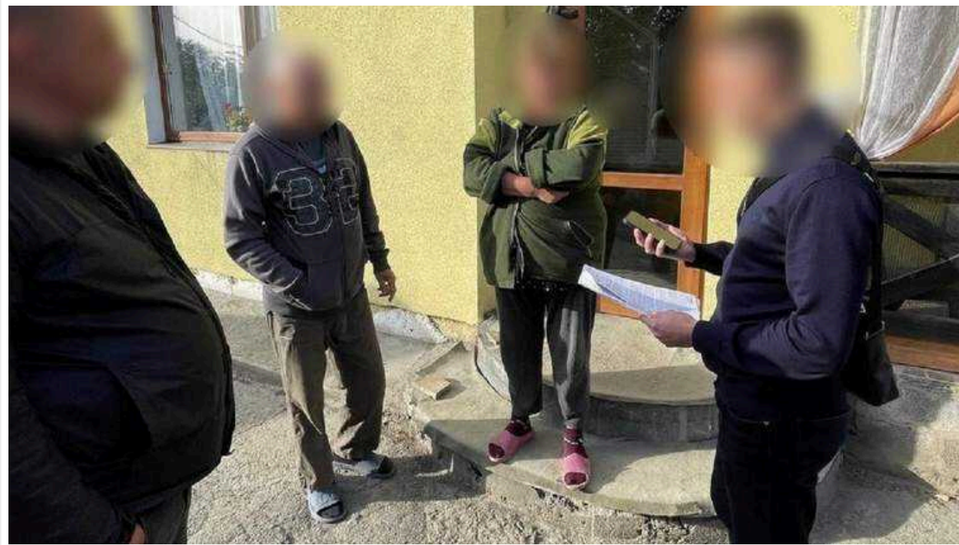
У Дніпрі затримали експрацівників банку за крадіжку понад 60 мільйонів гривень

У Дніпрі колишні працівники банку вкрали у вкладників понад 60 млн грн. За даними слідчих, шахрайську схему організував начальник одного з відділень банку.