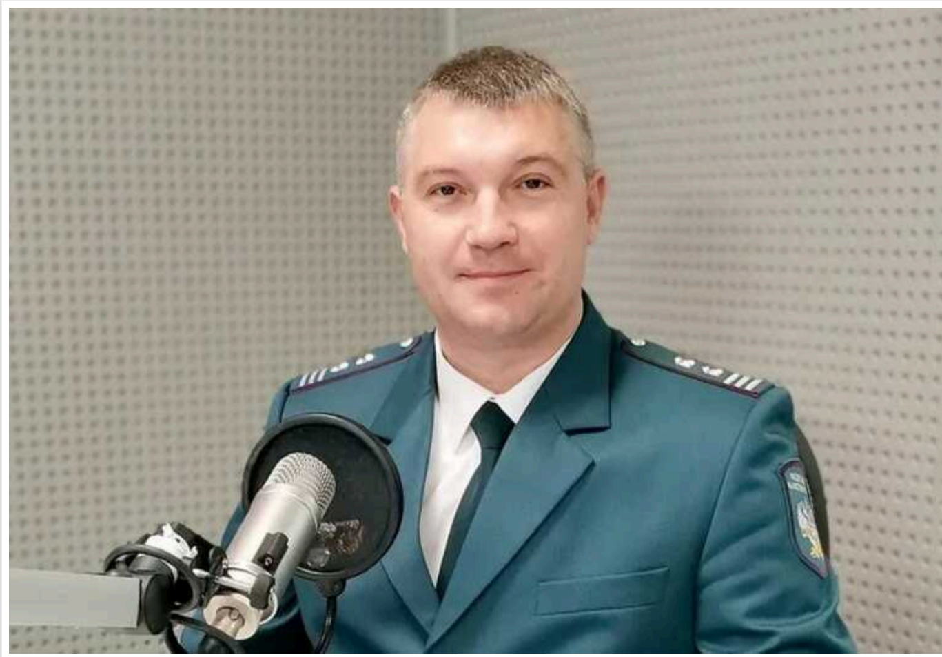
СБУ повідомила про підозру колаборанту з Криму, який примушує бізнес платити податки окупантам

Співробітники Служби безпеки України повідомили про підозру високопосадовцю окупаційної влади Криму, який перейшов на бік російських загарбників з лютого 2014 року. Наразі колаборант активно співпрацює з ворогом та примушує підприємців на півострові сплачувати податки адміністрації "губернатора" Сергія Аксьонова.