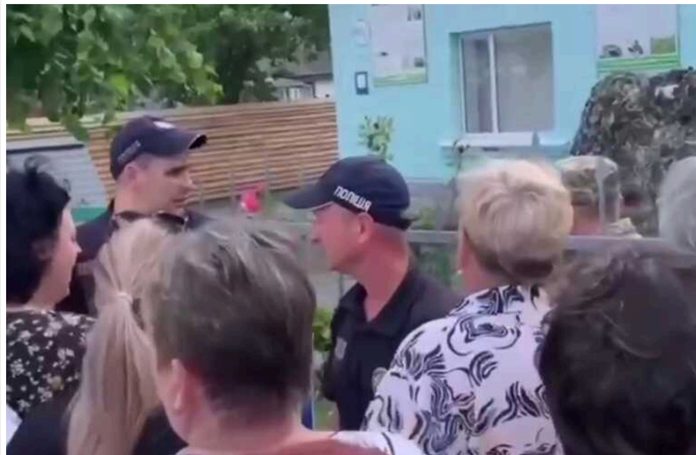
На Житомирщині біля ТЦК, у якому загинув мобілізований, зібрався мітинг