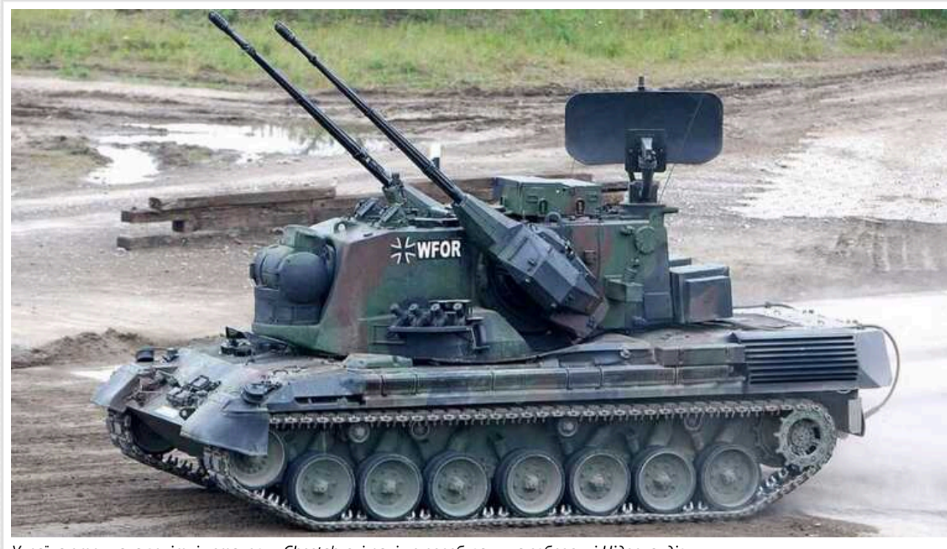
Україна отримала зенітні установки Sheethah, які раніше перебували на озброєнні Нідерландів

Українські воїни для захисту повітряного простору від ворожих цілей стали використовувати установки під назвою Sheethah. Це аналог німецького "Тепарда".