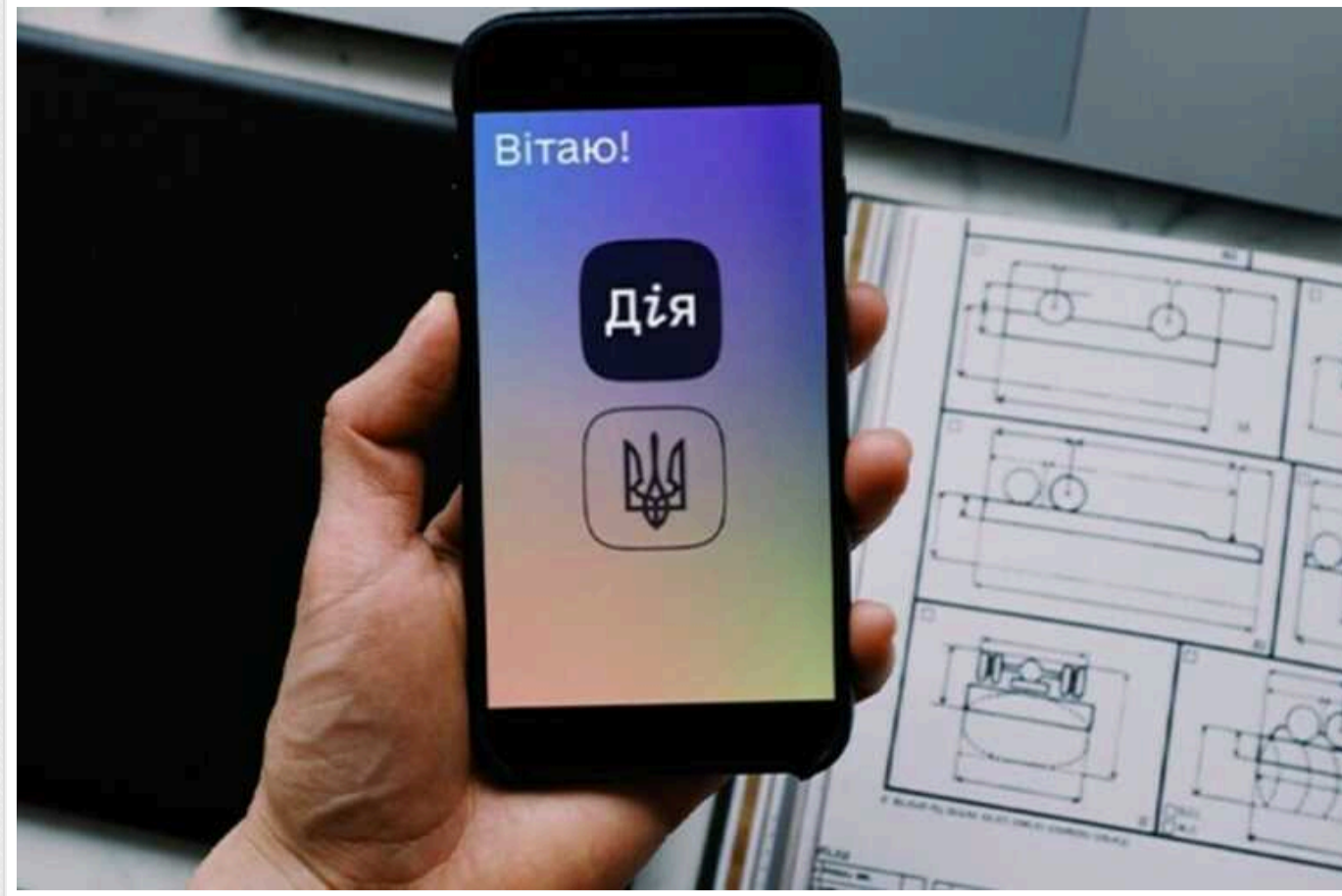
У Мінцифри спростували інформацію про те, що "Дія" відстежує пересування українців

Читати на руском Додати як бажане джерело в Google