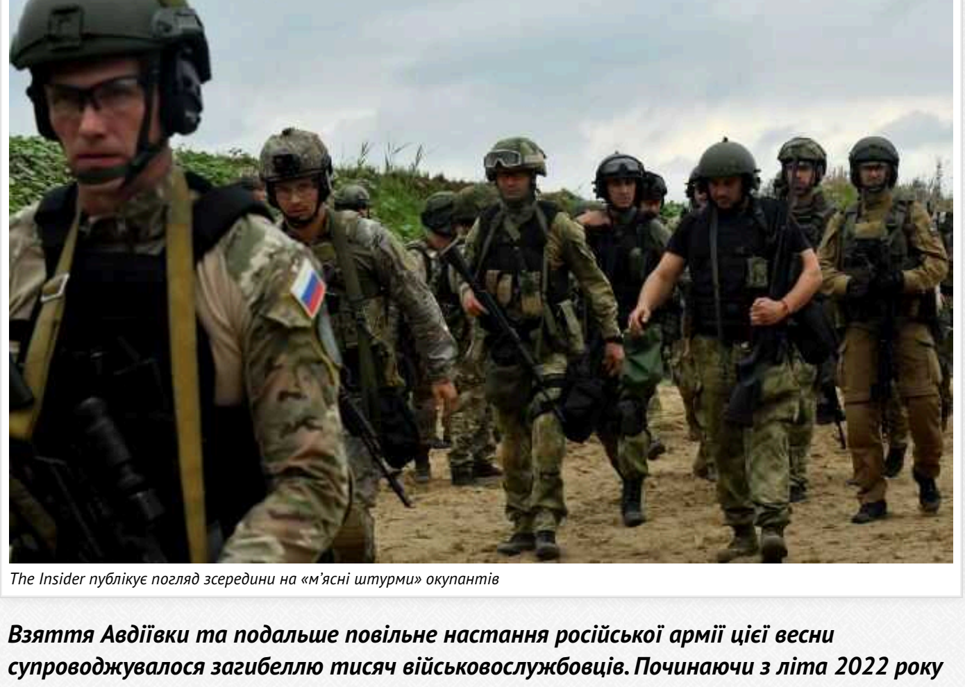
The Insider публікує погляд зсередини на м'ясні штурми окупантів

Війна Авдіївки та подальше повільне наступання російської армії цією весною супроводжувалося загальною тисяєю військослужбовців. Починаючи з літа 2022 року російське командування неодноразово пославало солдатів на самоцвпні штурми, викрадаючи особовий склад як «м'ясо».