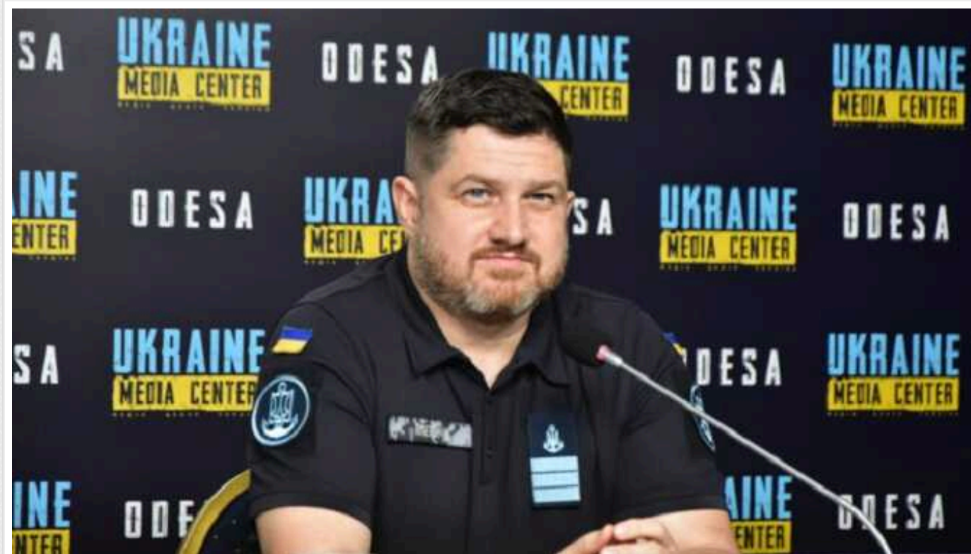
Сили оборони знищили на півдні два російські "Панцир" та командний пункт окупантів

Сили оборони знищили на півдні два російські "Панцирі". Окрім того, був відмінусований командний пункт окупантів.