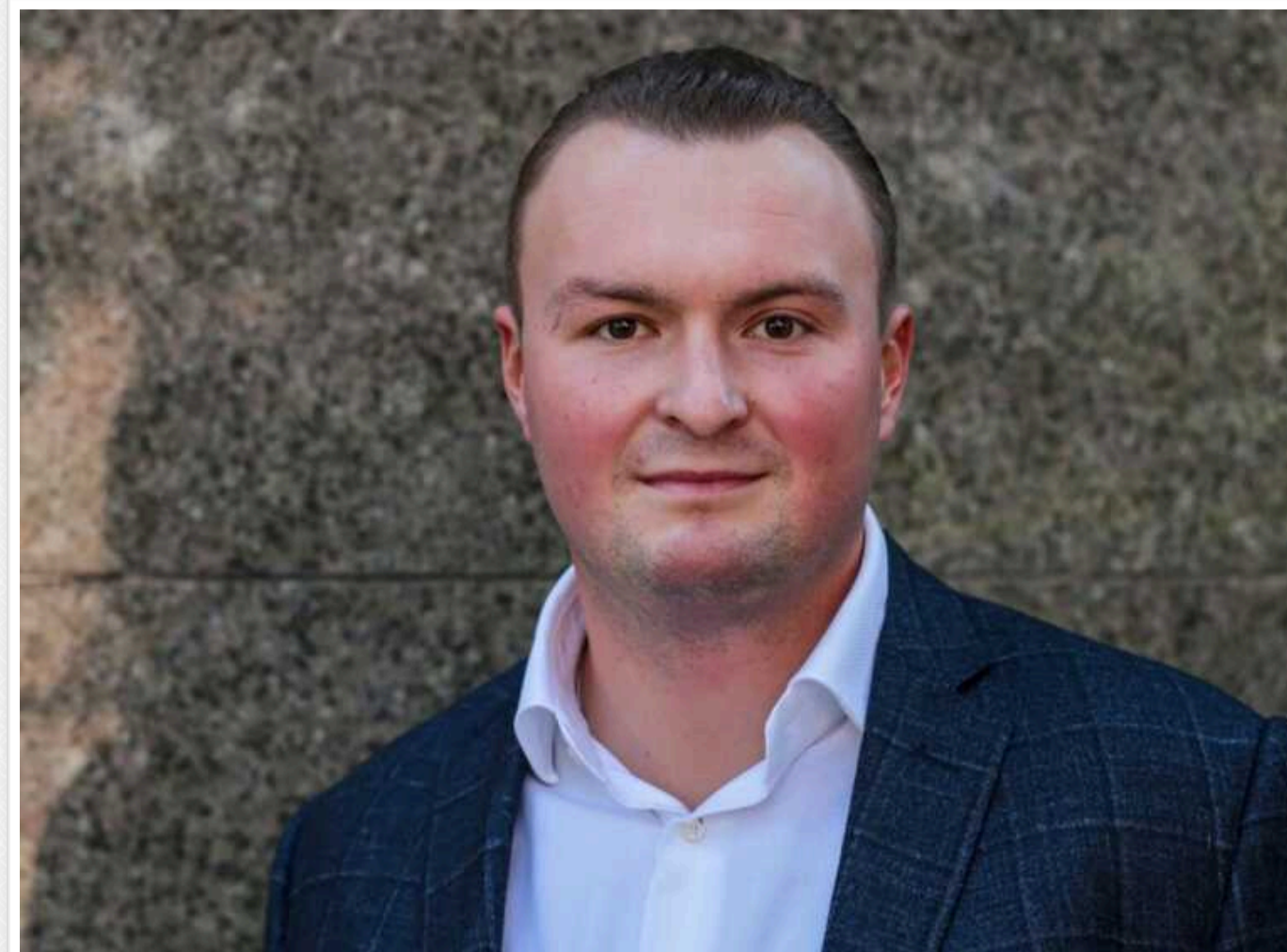
Справу Гладковського-молодшого передали до ВАКС

Спеціалізована антикорупційна прокуратура направила до суду обвинувальний акт щодо сина колишнього першого заступника секретаря РНБО Олега Гладковського Ігоря та ексгенерального директора «Укроборонпрому» Павла Букіна про зловживання.