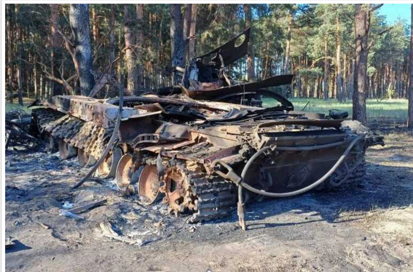
Генштаб оприлюднив оновлені дані щодо втрат РФ: мінус 1280 російських окупантів та 40 артсистем

Напередодні, 4 червня, Сили оборони на лінії фронту "відмінували" 1280 російських окупантів. Таким чином втрати РФ у живій силі за час повномасштабного вторгнення в Україну сягнули 513 700 осіб.