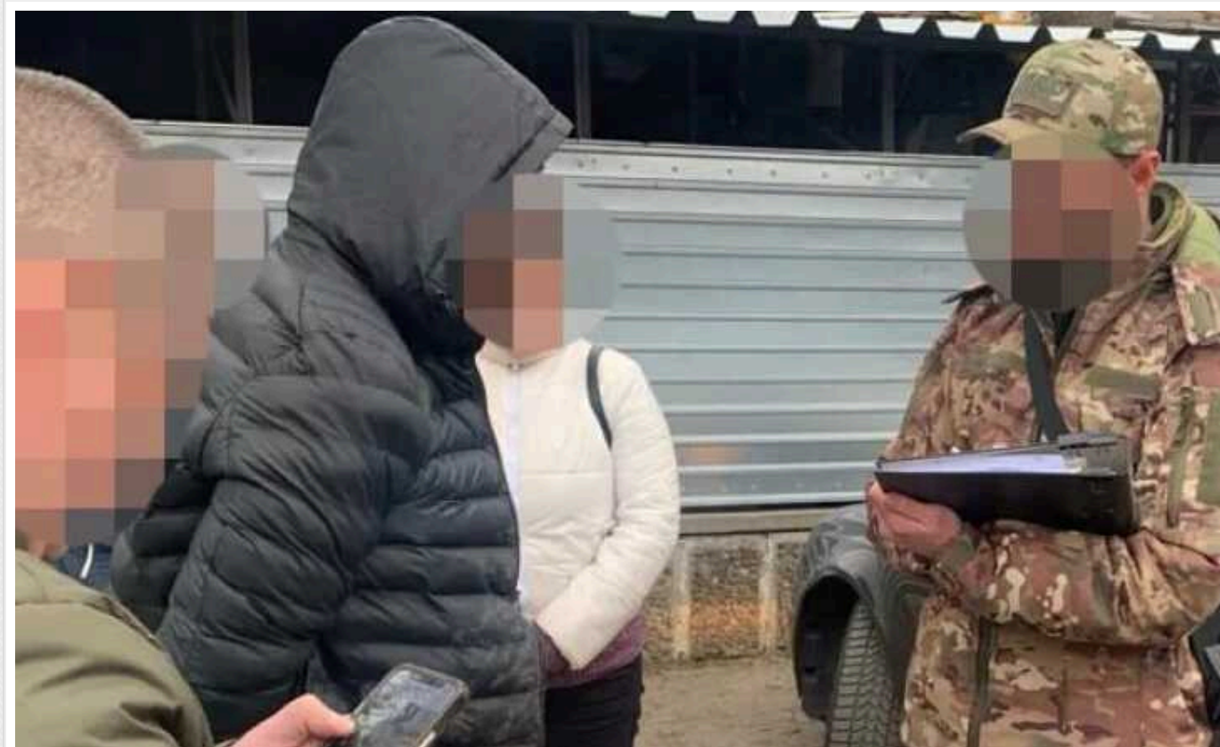
В Одесі судитимуть поліцейського, який переправляв ухлянтів за кордон

До суду передають справу правоохоронця з Одеси, який організував канал виїзду військовозобов'язаних чоловіків до Молдови. У спільники він намагався залучити знайомого прикордонника.