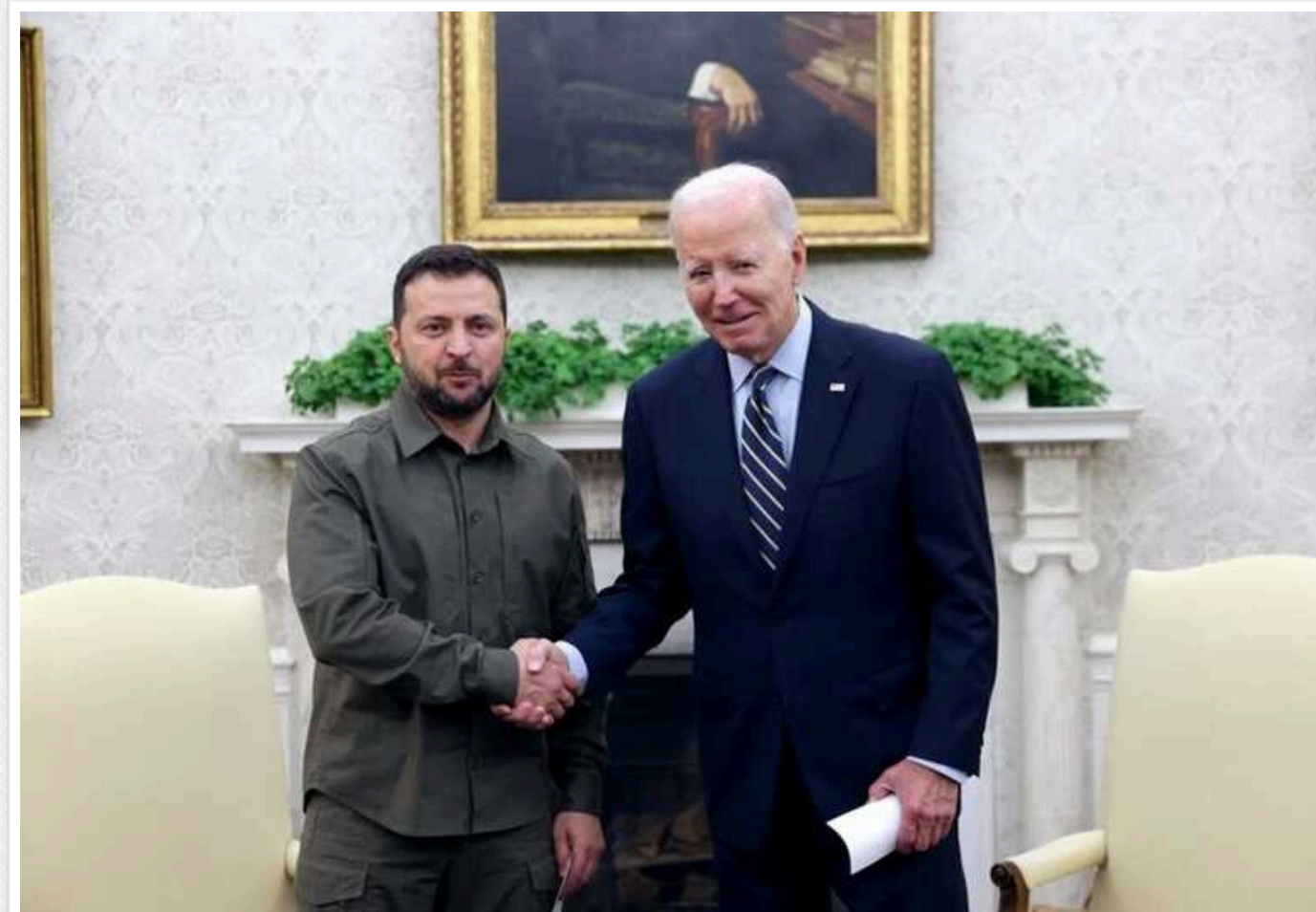
Зеленський і Байден проведуть дві зустрічі найближчими тижнями, – Джейк Салліван

Президент України Володимир Зеленський двічі зустрінеться із американським лідером Джо Байденом найближчим часом. Перша зустріч відбудеться вже цього тижня.