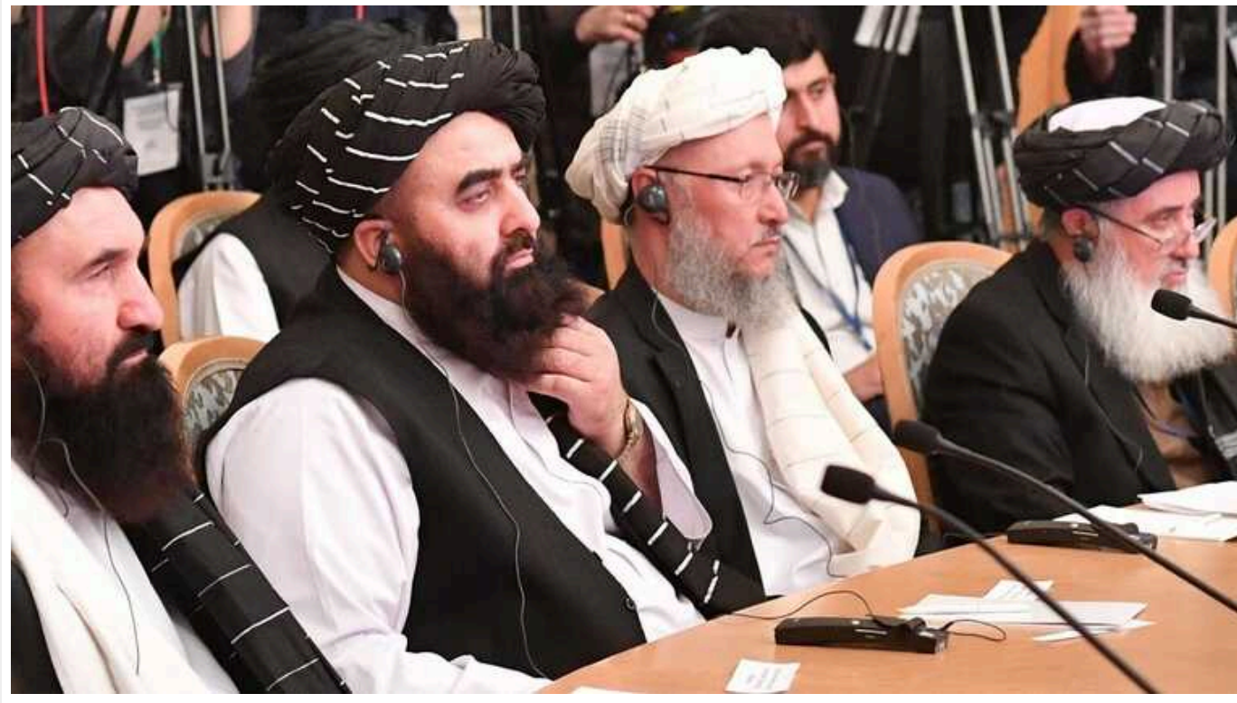
Кримські гауляйтери налагоджуватимуть «співпрацю» з «Талібаном», – ЦНС

Російські окупанти продовжують маргіналізувати тимчасово окупований український Крим. Нині вони планують налагодити "співпрацю" з режимом "Талібан" в Афганістані: зустріч кримських гауляйтерів та представників терористичного режиму заплановано у рамках "міжнародного економічного форуму" у російському Санкт-Петербурзі.