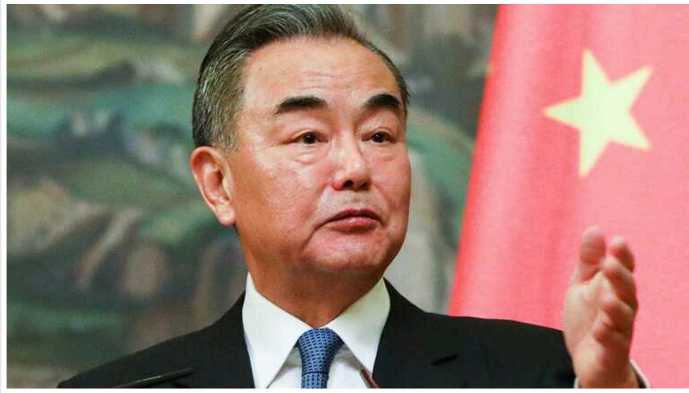
У МЗС Китаю заявили, що їхній план припинення війни підтримали понад 20 країн

Міністр закордонних справ КНР Ван І заявив, що понад два десятки країн висловили підтримку китайському плану щодо припинення війни в Україні.