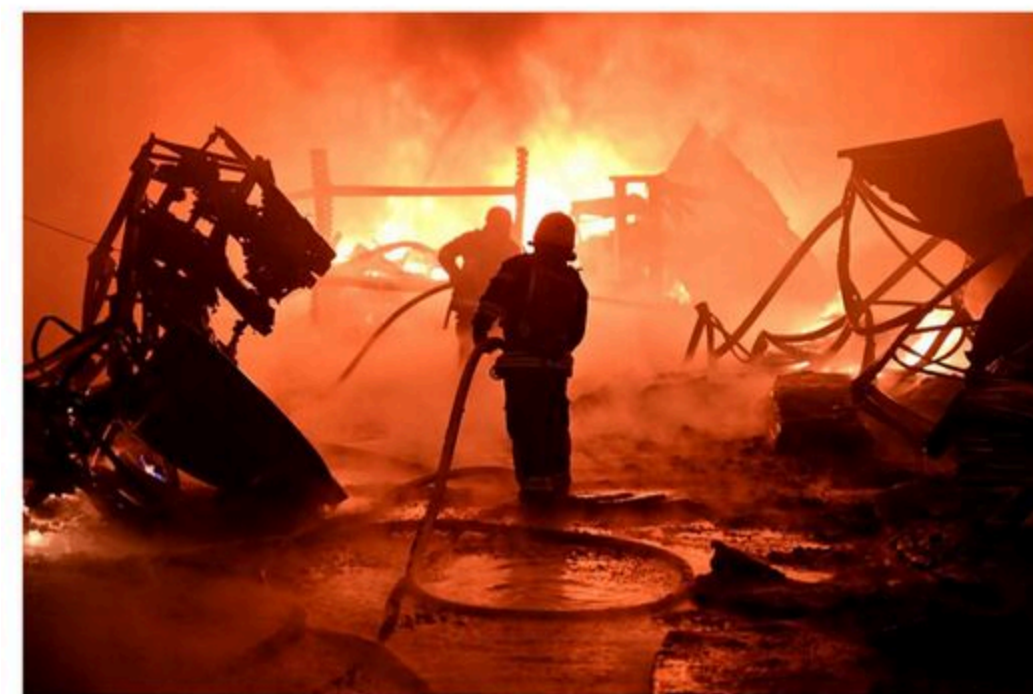
Ukrainian firefighters work to extinguish a blaze in Kharkiv in May.