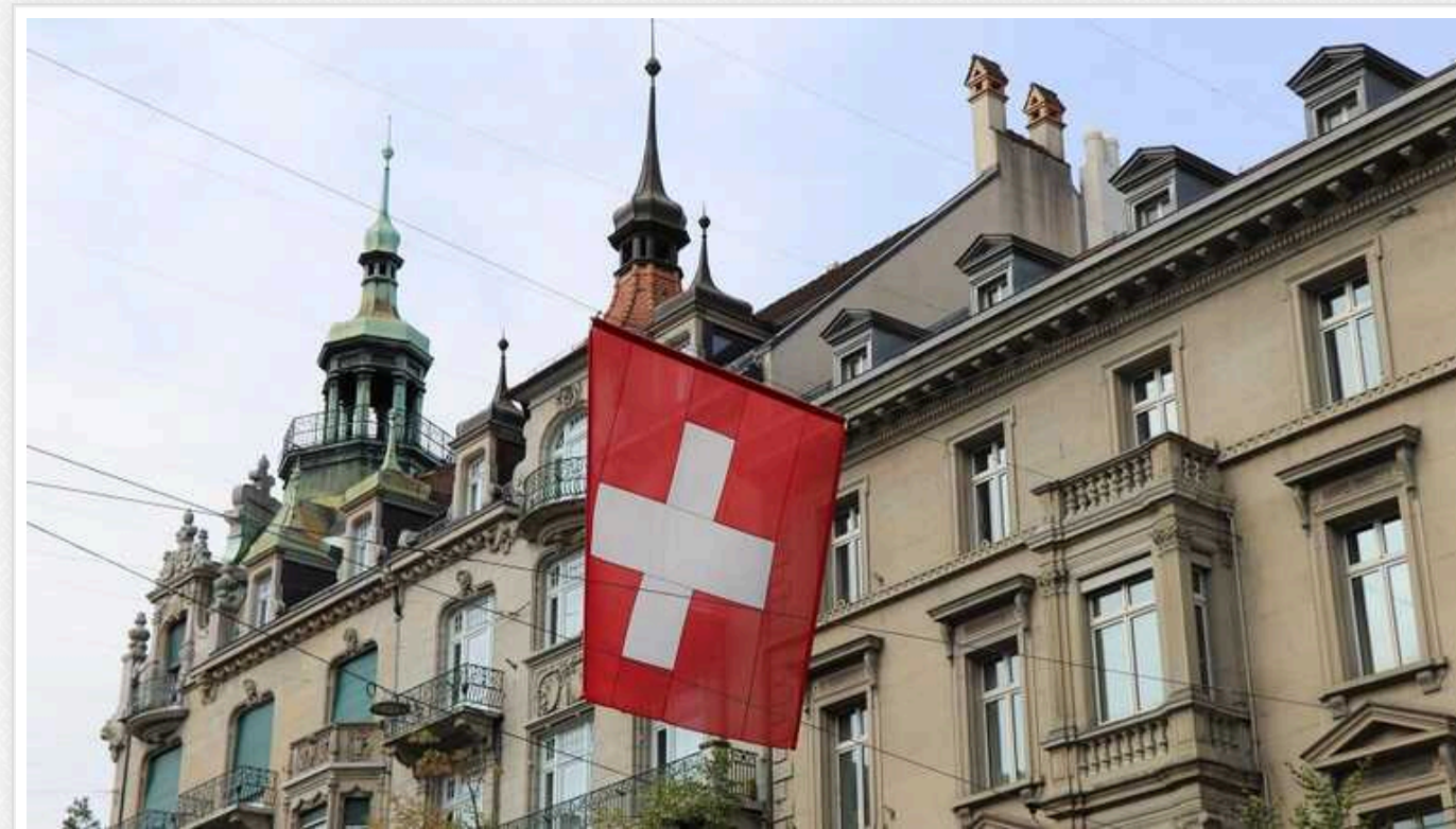
Bloomberg: Саміт у Швейцарії відчинить двері для "обмежених" майбутніх переговорів із РФ

Bloomberg пише, що саміт у Швейцарії відчинить двері для "обмежених" майбутніх переговорів з Росією.