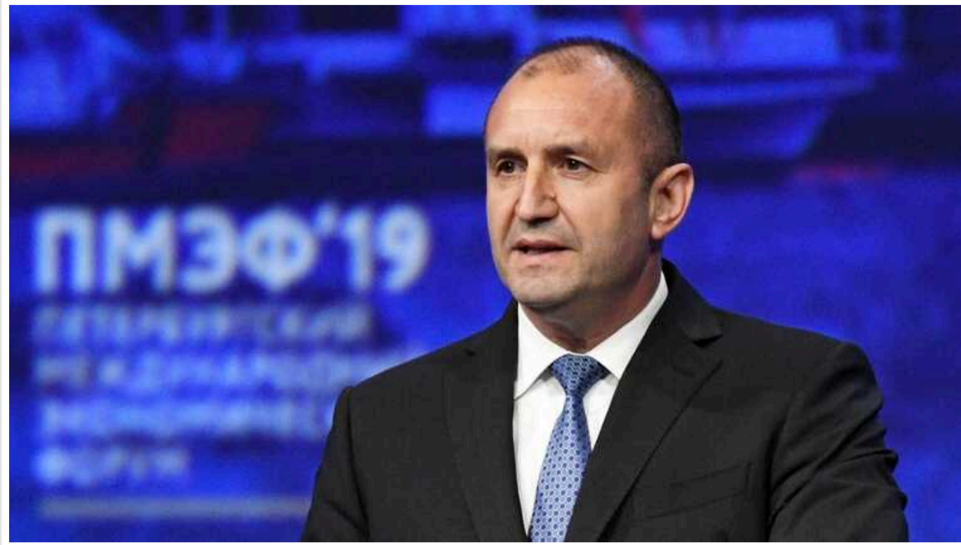
Президент Болгарії каже, що дозвіл Україні бити по Росії веде до "ядерного Армагеддону"

Президент Болгарії Румен Радев критикує НАТО за дозвіл Україні завдавати ударів західною зброєю по РФ, вважаючи, що це загрожує "ескалацією" і "ядерним Армагеддоном".