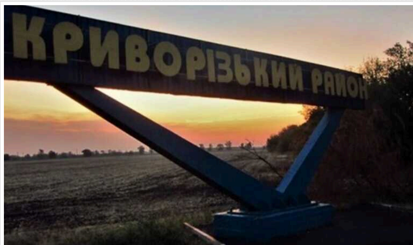
Росіяни атакували Дніпропетровщину, є постраждалий

Російські війська вдень 4 червня атакували Дніпропетровську область. Вибух пролунає у Криворізькому районі: там пошкоджено приватний будинок.