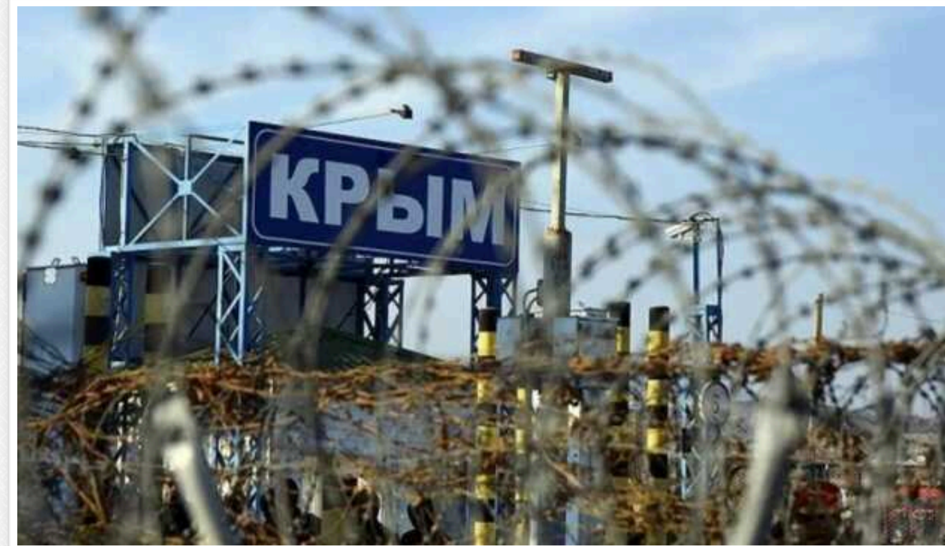
Партизани в окупованому Криму зафіксували підвищену активність росіян в аеропорту "Заводське"

Агенти військового руху українців та кримських татар "Атеш" фіксують збільшення активності в аеропорту "Заводське" у тимчасово окупованому Криму. На раніше занедбаному летовищі окупанти почали з суто військовою метою залучати авіацію.