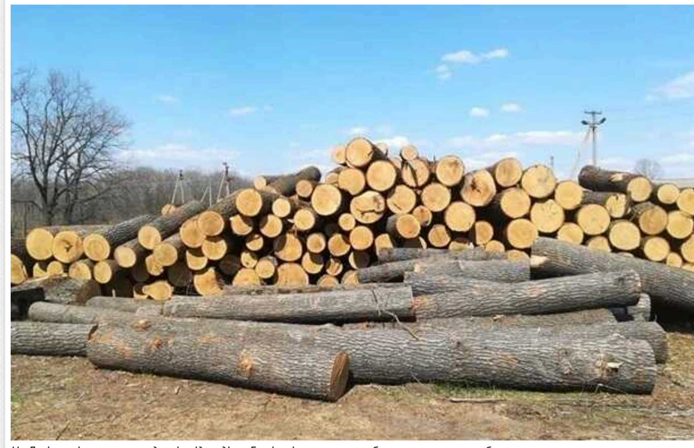
На Львівщині викрили посадовців підрозділу «Галсільлісу» на масштабних незаконних вирубках

Оперативники департаменту стратегічних розслідувань Нацполіції викрили посадовців Золочівського дочірнього лісгосподарського підприємства «Галсільлісу» на незаконних рубках дерев на майже 600 тис. грн.