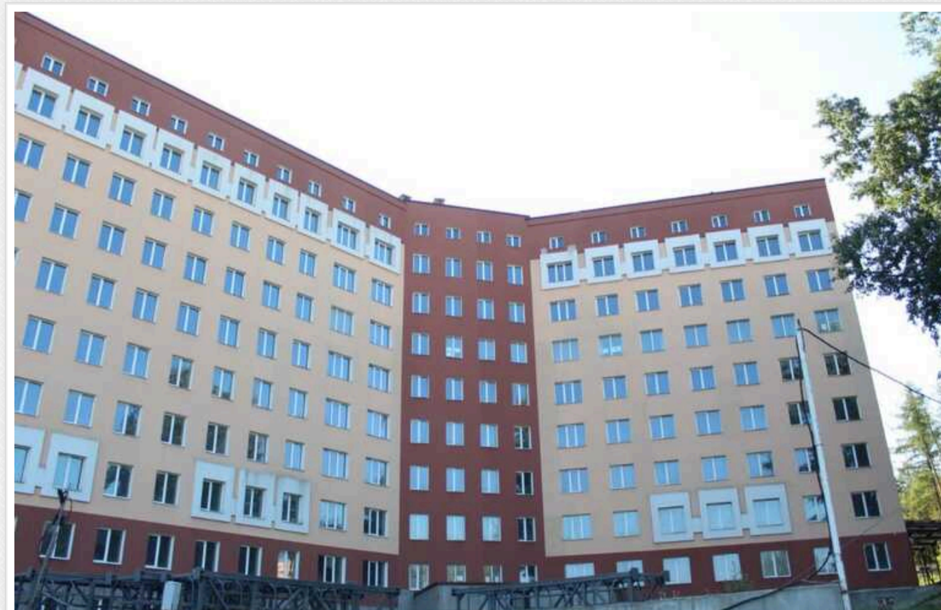
В Хмельницькому добудову лікарні за 244 мільйони замовили фірмі з «заброньованими» чоловіками

КП «Архбудпроект» Хмельницької облради 23 квітня і 24 травня за результатами тендерів замовило ТОВ «Будівельний Альянс Груп» будівництво корпусу Хмельницької обласної дитячої лікарні зі сховищем за 243,50 млн грн.