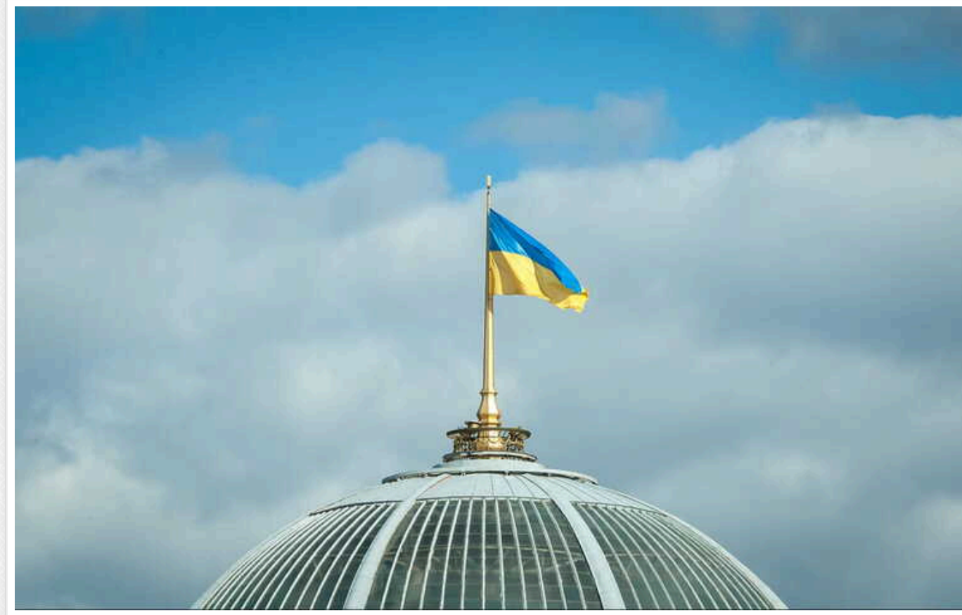
Верховна Рада підтримала у першому читанні підвищення акцизів на цигарки

Верховна Рада підтримала у першому читанні законопроект #11090 про підвищення акцизного податку на тютюнові вироби.