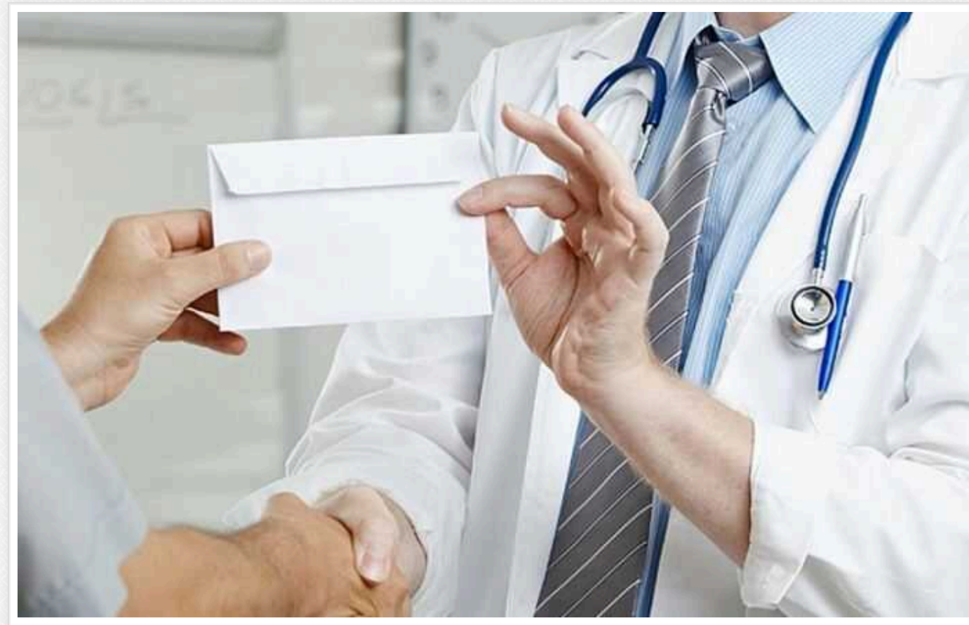
У Запорізькій області в Оріхові бухгалтери лікарні привласнили на зарплатах 28 мільйонів гривень

Шестеро працівниць навмисно нараховували завищену зарплату працівникам лікарні прифронтового Оріхова Запорізької області, а різницю привласнювали. Правоохоронці зібрали докази їхньої злочинної діяльності.