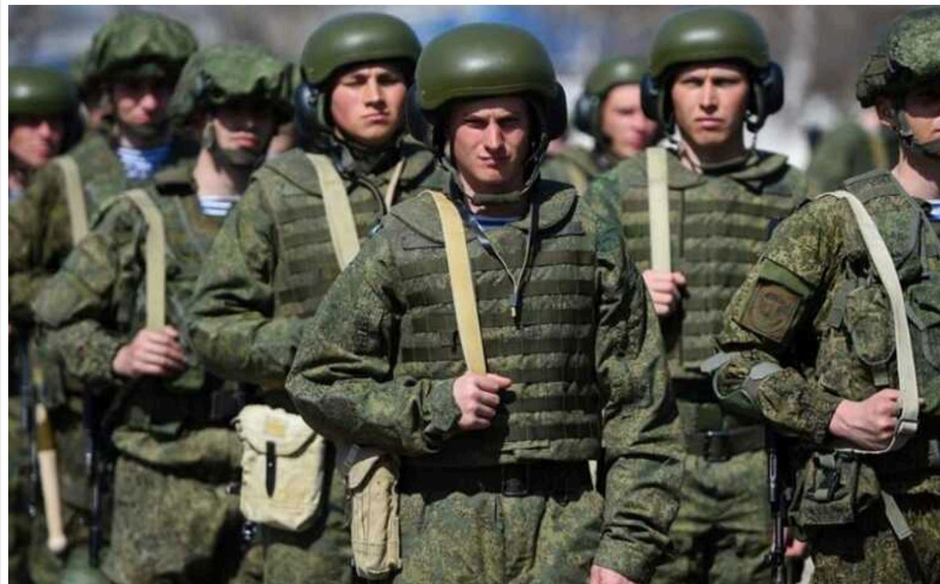
Окупанти просунулися в районі Часового Яру

Ворог трохи просунувся на дачах на північ від мікрорайону Канал, пише військовий блогер Богдан Мірошников.