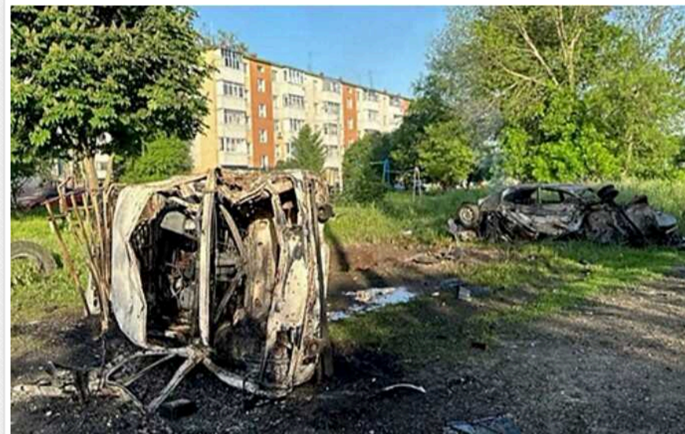
Жителі Белгородщини скаржаться на ситуацію в області: «Робимо санітарну зону, але гірше від цього нам»

Росіяни скаржаться на постійні обстріли в Белгородській області країни-агресора – начебто прилітає по 30 ракет. За їхніми словами, у регіоні нібито роблять "санітарну зону", проте від цього лише гірше.