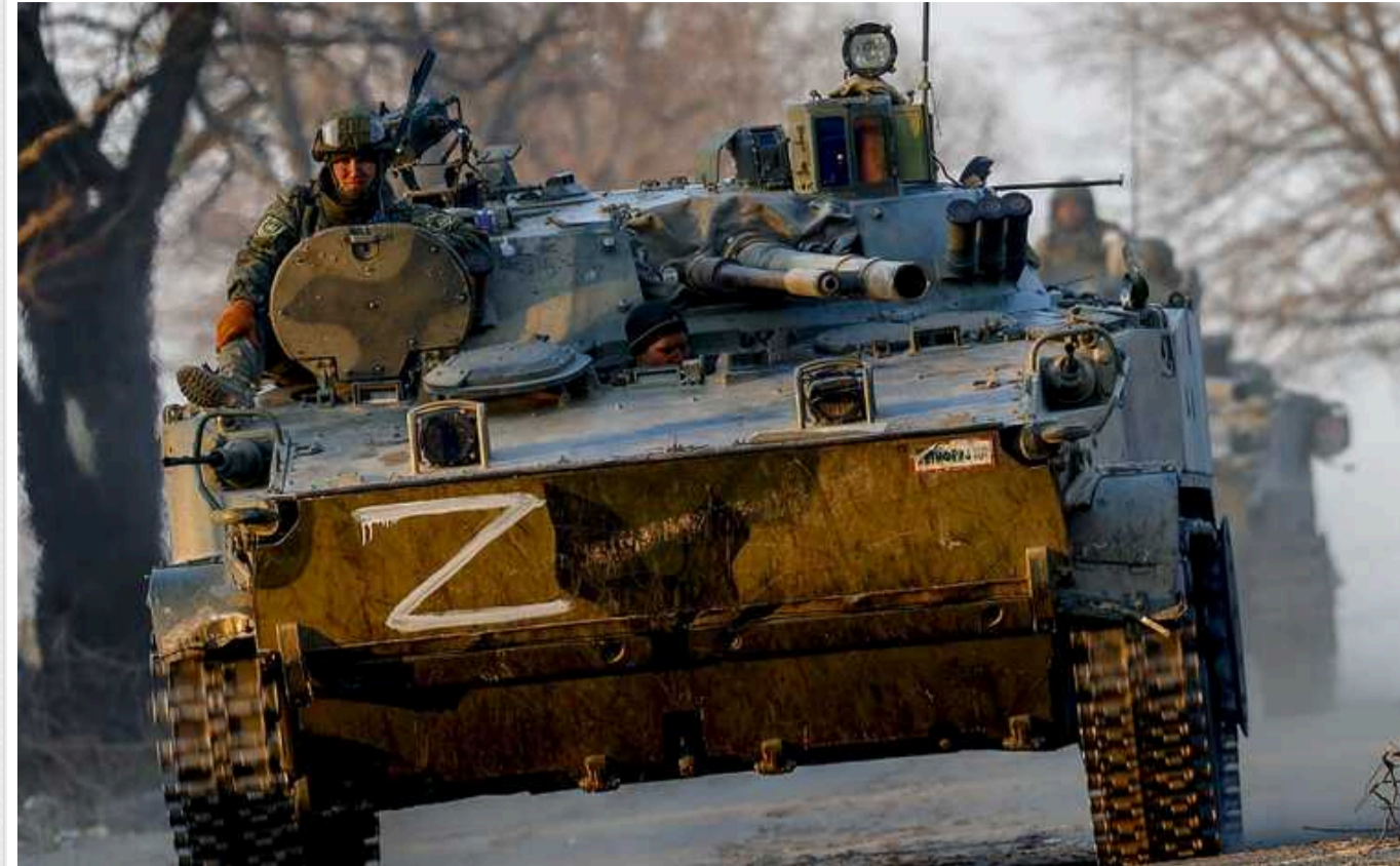
Сухопутні війська Кольського півострова РФ «знищені» на війні в Україні, – очільник армії Норвегії

Головнокомандувач армії Норвегії генерал Ейрік Крістоферсен заявив, що сухопутні війська Росії на Кольському півострові "знищені" після великих втрат у війні проти України.