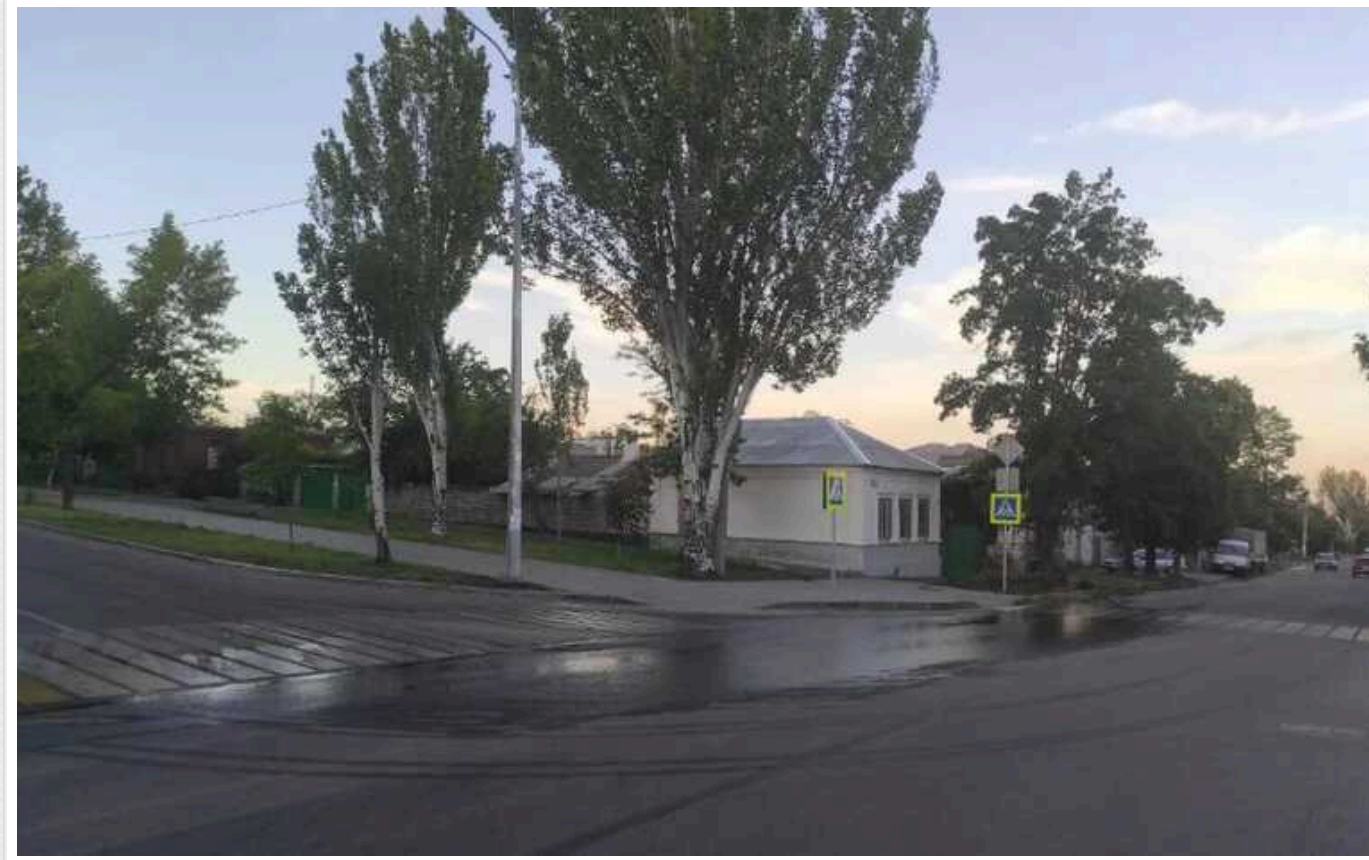
Центр окупованого Маріуполя заливає каналізаційними відходами

Центр захопленого Росією Маріуполя через недбалість окупантів заливає каналізаційними відходами, які потрапляють до міських річок та Азовського моря. Через таку ситуацію загарбники заборонили людям купання в морі.