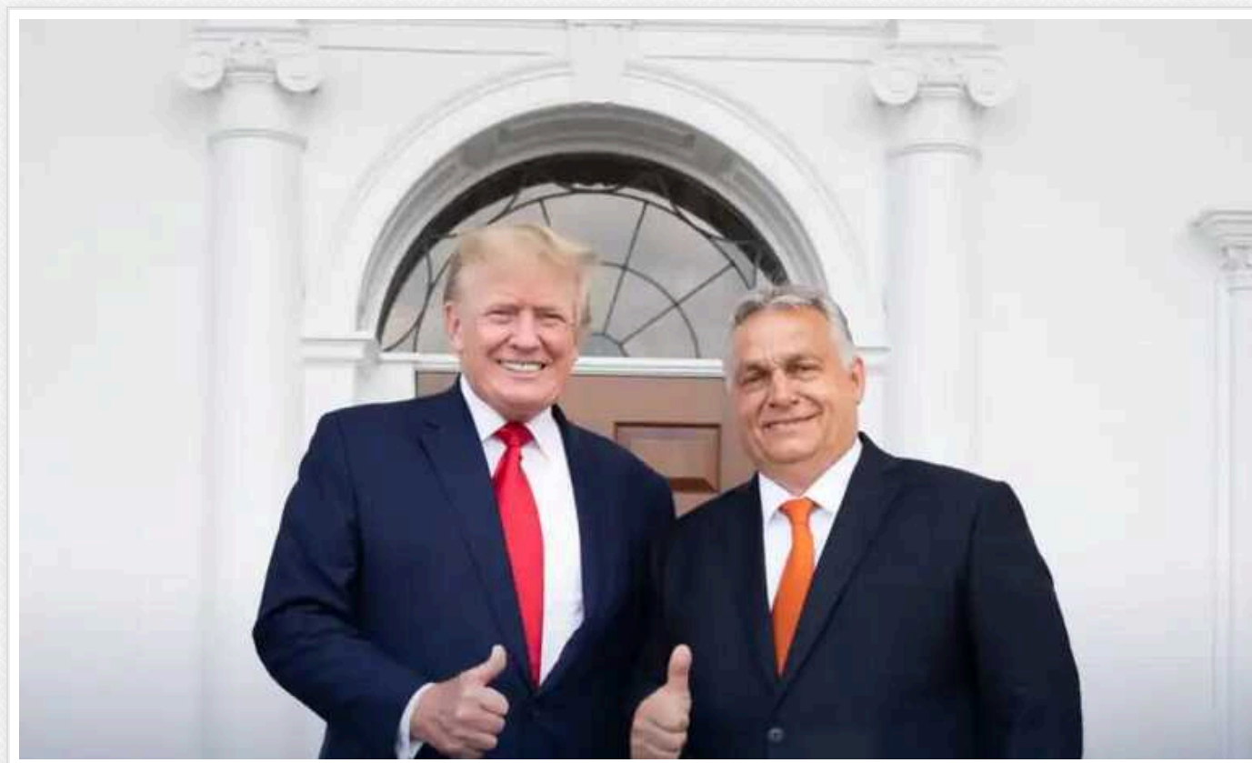
Трамп може за один день досягти припинення вогню в Україні та розпочати переговори, – Орбан

Прем'єр-міністр Угорщини Віктор Орбан вважає, що Дональд Трамп, у разі перемоги на президентських виборах у США, за один день міг би досягти припинення вогню в Україні, а потім розпочати переговори.