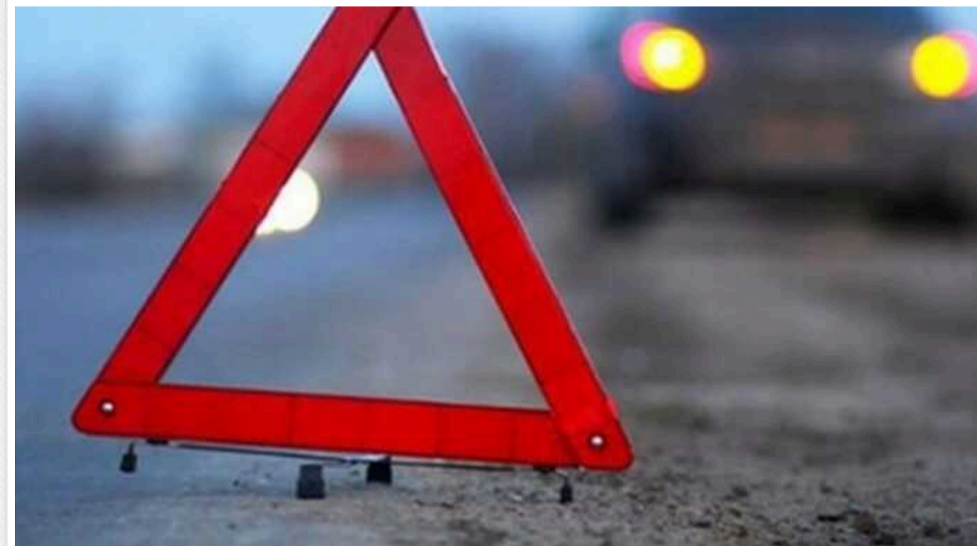
У Білій Церкві п'яний водій протаранив стіну будинку та мало не збив пішохода

У Білій Церкві Київської області водій легковика ледь не збив пішохода, а потім на швидкості протаранив стіну будинку. Як виявилось, чоловік сів за кермо у стані алкогольного сп'яніння.