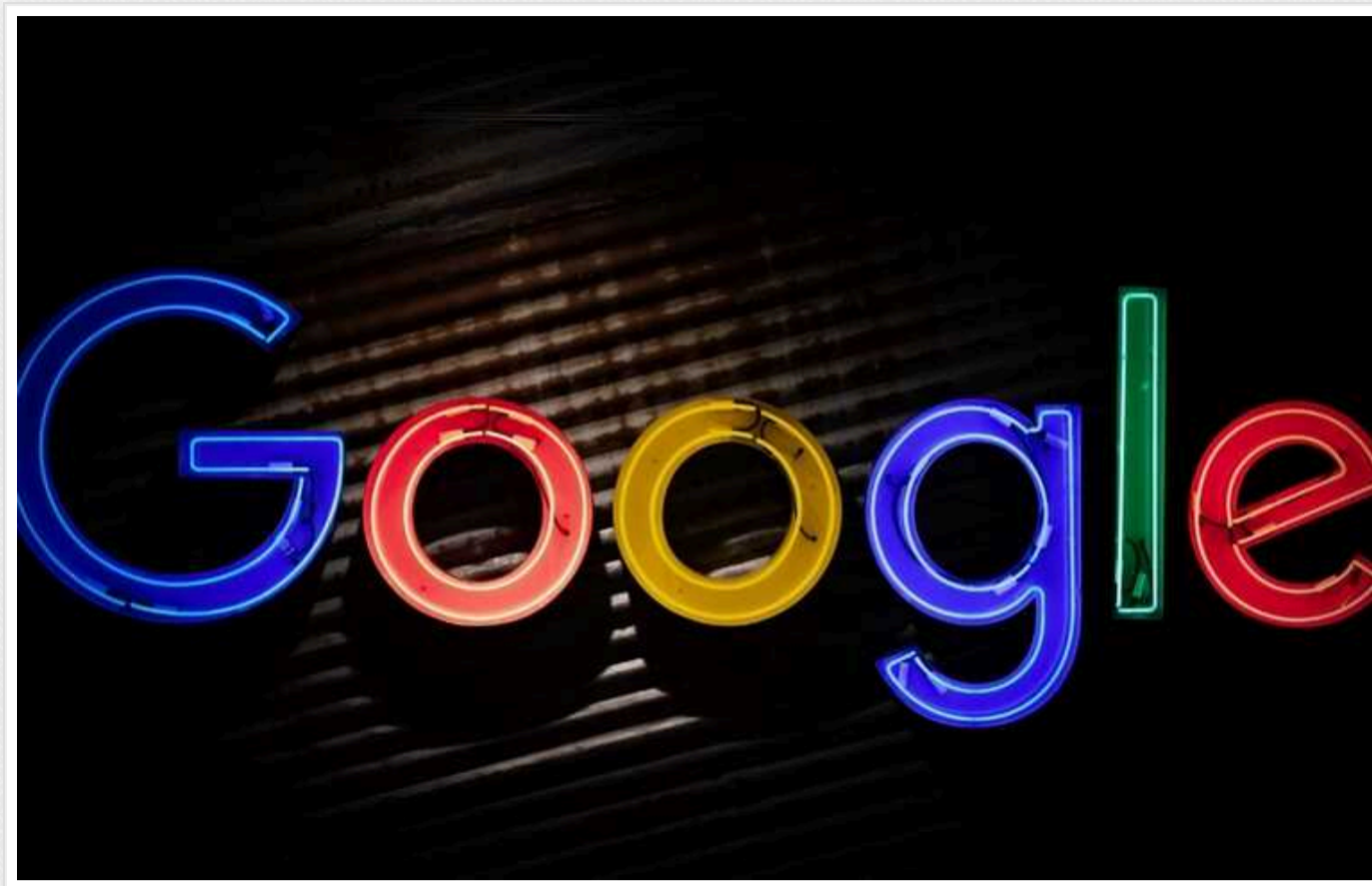
У Google не вберегли дані понад мільйона людей, – ЗМІ

Google записував голоси дітей, зберігав номерні знаки зі Street View і давав рекомендації YouTube на основі видаленої історії перегляду, йдеться у звітах співробітників компанії.