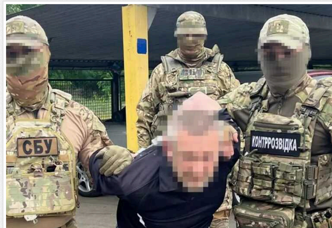
У Запоріжжі СБУ затримала агента РФ, який хотів підірвати автівки працівників ТЦК

Служба безпеки України викрила та затримала на гарячому агента ФСБ РФ, який готував підрив автівок співробітників місцевих військоматів у Запоріжжі.