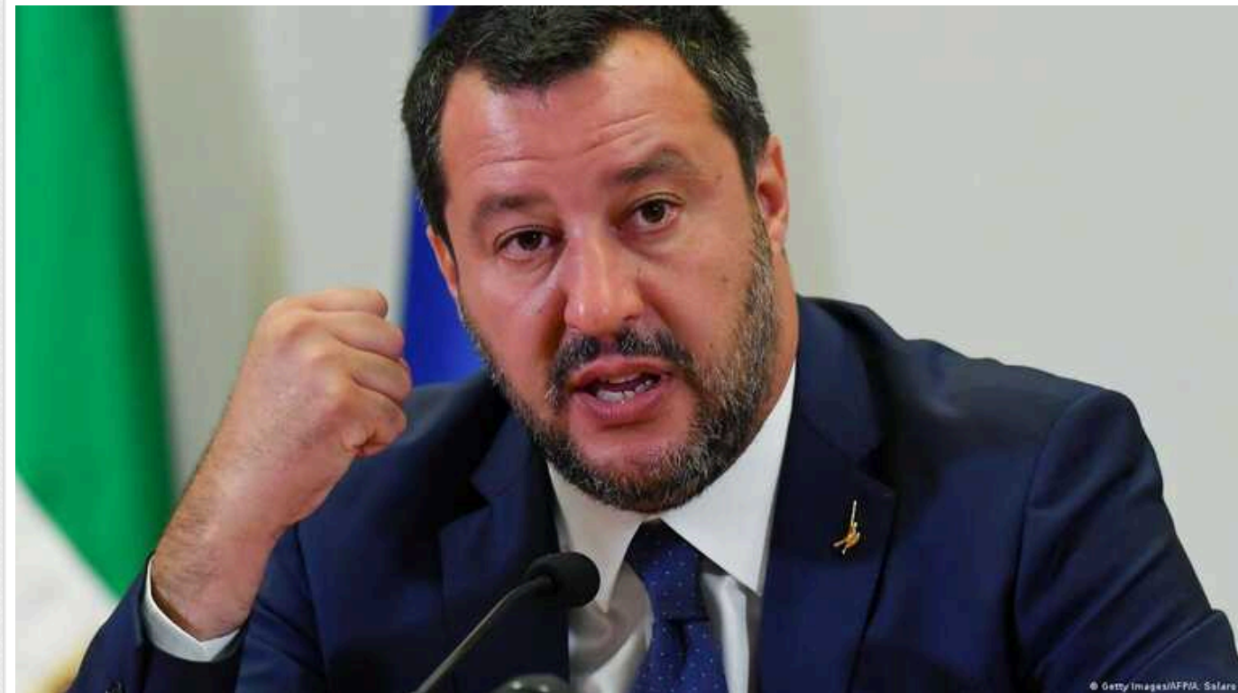
Віцепрем'єр Італії Маттео Сальвіні закликав президента Франції поїхати на війну до України

"Макрону я скажу: ти їдь в Україну воювати, одягни каску і не мороч італійцям голову"; – заявив Сальвіні на передвиборному заході в Барі.