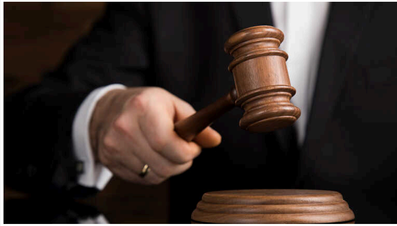
На Львівщині судили військового, який на кілька годин покинув службу

Яворівський районний суд Львівщини визнав Валерія М. винним у недбалому ставленні до військової служби. Військовий був відсутній на службі кілька годин і суд призначив йому 17 тис. грн штрафу.