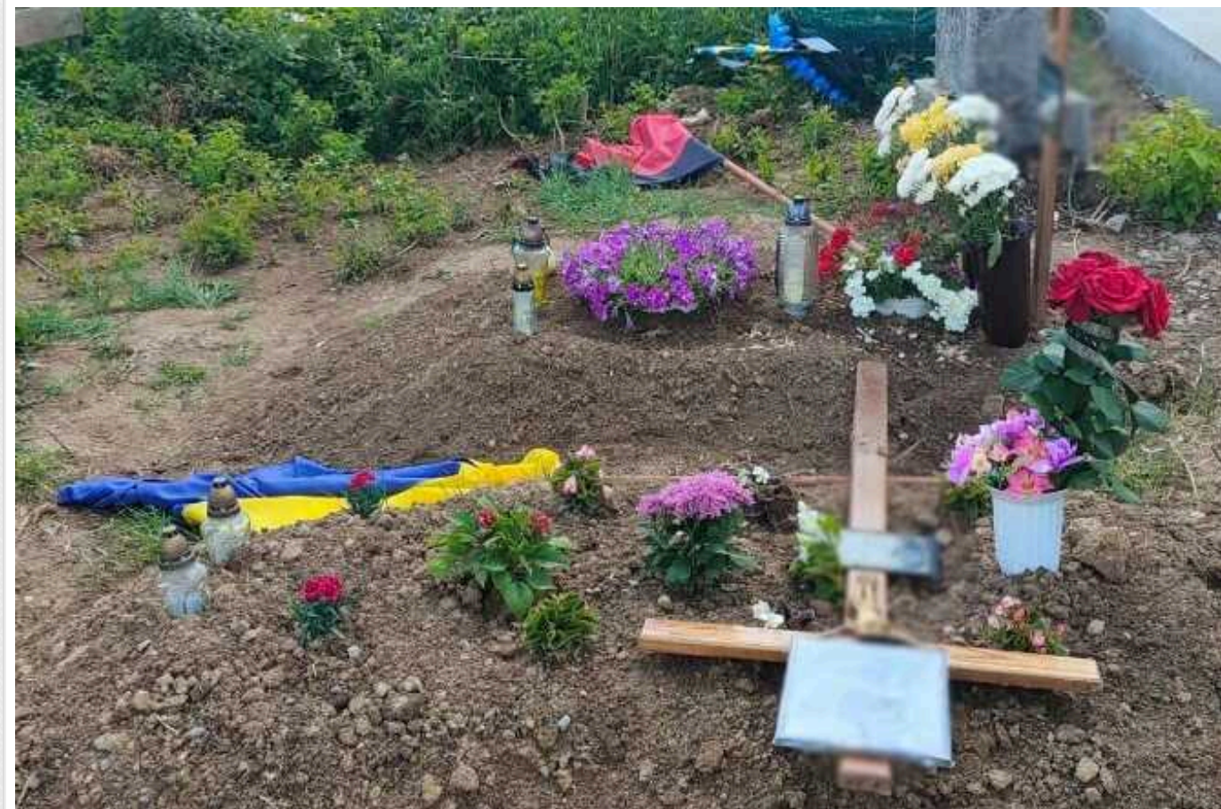
На Тернопільщині вчинили наругу над могилами захисників України

У селищі Гусятин у Тернопільській області вчинили наругу над могилами воїнів Сил оборони України, які загинули, захищаючи нашу державу від російського вторгнення. Зловмисника вже затримали, його можуть кинути за ґрати на строк до п'яти років.