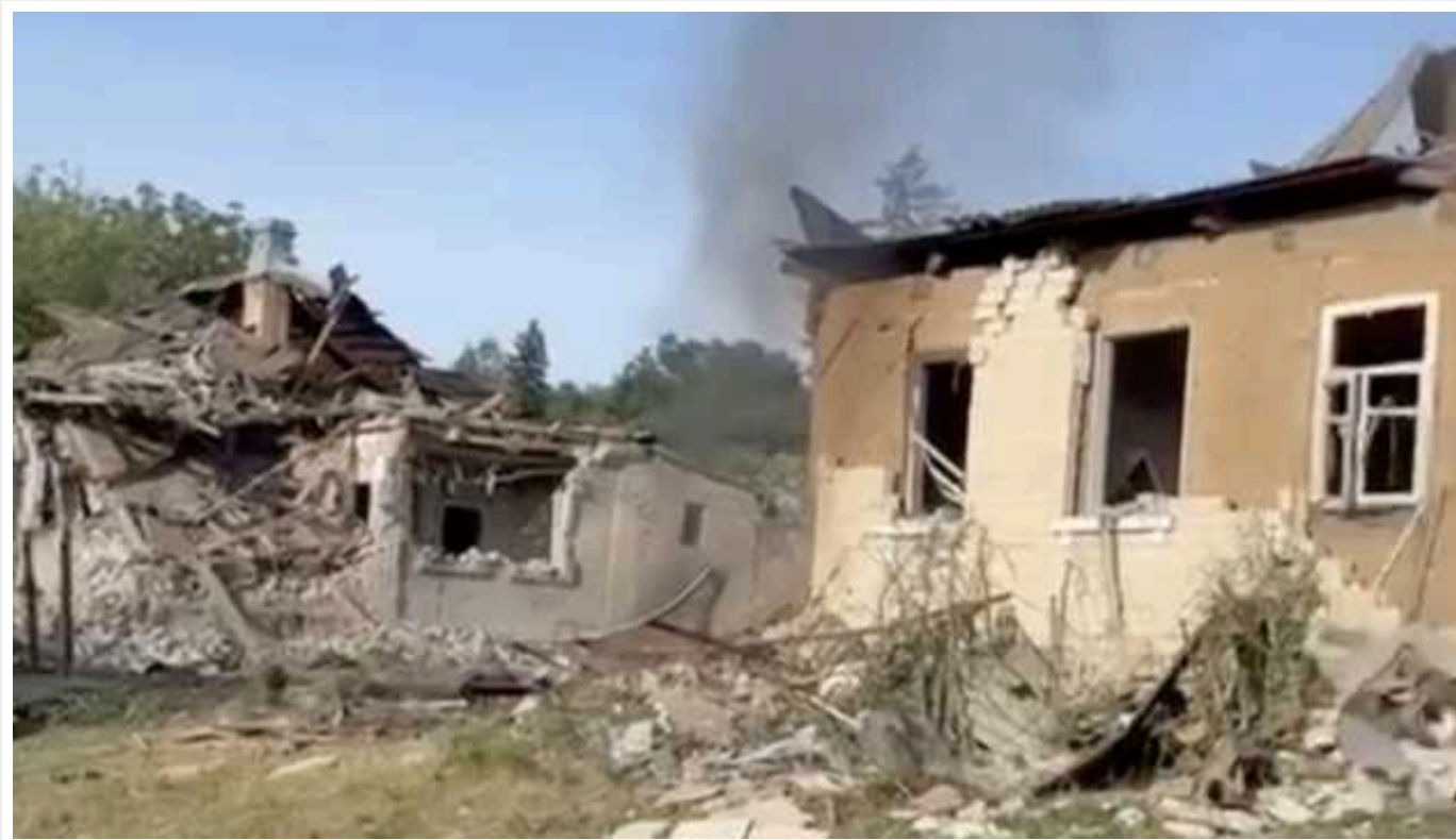
Окупанти обстріляли Куп'янськ: є постраждалий

Вранці у вівторок, 4 червня, російська армія здійснила обстріл Куп'янська Харківської області, постраждала одна людина.