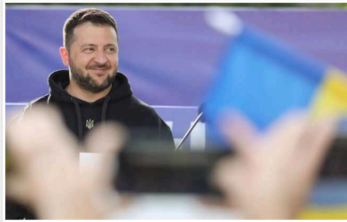
На Саміті G7 Зеленський говоритиме про пришвидшення поставок F-16

Президент України Володимир Зеленський на Саміті G7, який відбудеться 13-15 червня в місті Бріндізі на півдні Італії, говоритиме про кроки, які необхідні для пришвидшення поставок літаків-винищувачів F-16 в Україну.