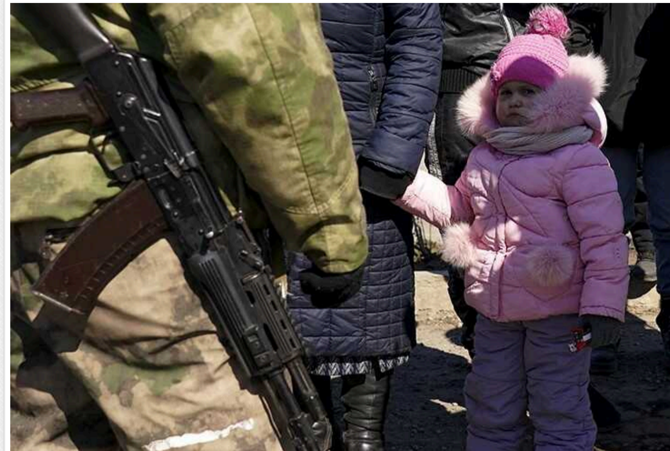
Окупанти вивезли із Херсона 46 дітей: NYT опублікувала гучне розслідування

На початку повномасштабного вторгнення країна-агресор вивезла з Херсона 46 дітей. І дотепер ніхто з них не був повернутий.