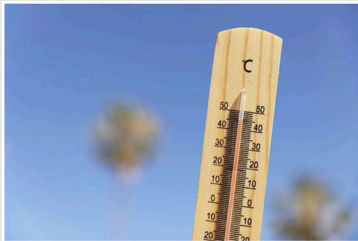
На завтра в Україні прогнозують спеку до +32

Спека поєднуватиметься з грозами, зливами та шквальними дощами. На сході, в центрі та на півдні дощів не очікується.